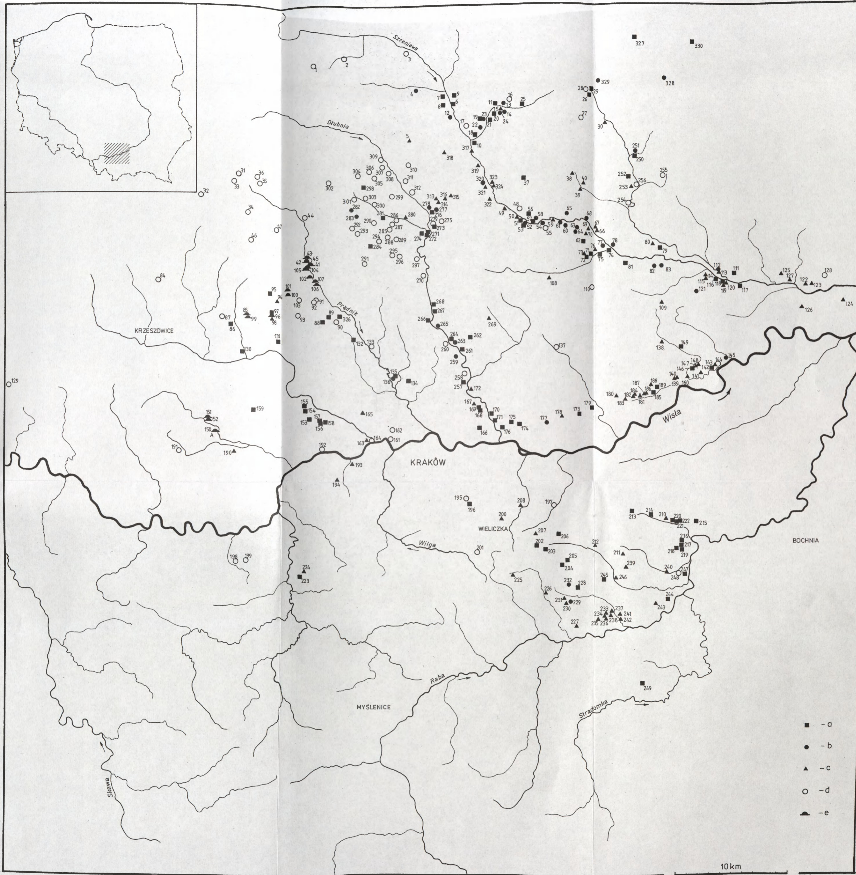
Ryc. 3. Rozmieszczenie punktów osadniczych kultury ceramiki wstęgowej rytej w zachodniej części Małopolski — stan badań na rok 2000; a — osada; b — obozowisko; c — ślad osadniczy; d — stanowisko o niepewnej przynależności do kultury ceramiki wstęgowej rytej. Rys. I. Jordan. Fig. 3. Location of settlement points of the Linear Band Pottery culture in western Lesser Poland — situation in 2000. a — settlement site; b — camp site; c — settlement trace; d — site possibly affiliated to the Linear Band Pottery culture. Drawn by I. Jordan