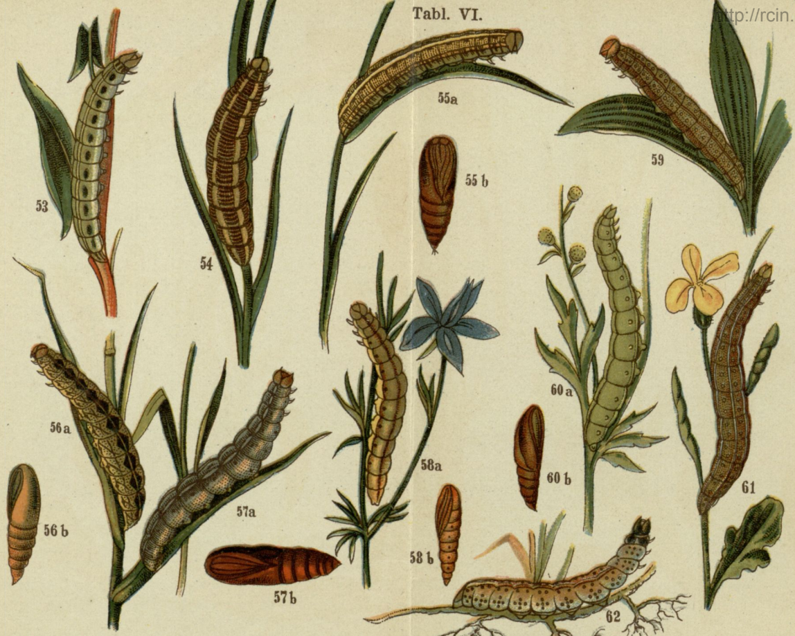
53. Rolnica plochliwa (rodzaj) ( Agrotis fugax ). 54. Splotka pierzanka czyli Siatka ( Neuronia popularis ). 55. Piętnówka krwawnica ( Mamestra leucophaea ). 56. Piętnówka chmurówka ( Mamestra nebulosa ). 57. Rolnica zbożówka cz. oziminówka ( Agrotis segetum ). 58. Marmurówka (rodzaj) ( Polia cappa ). 59. Rolnica czopówka ( Agrotis exclamationis ). 60. Sówka skalna ( Polia flavicincta ). 61. Marmurówka (rodzaj) ( Polia rufocincta ). 62. Sówka wróblówka ( Hadena monoglypha ).