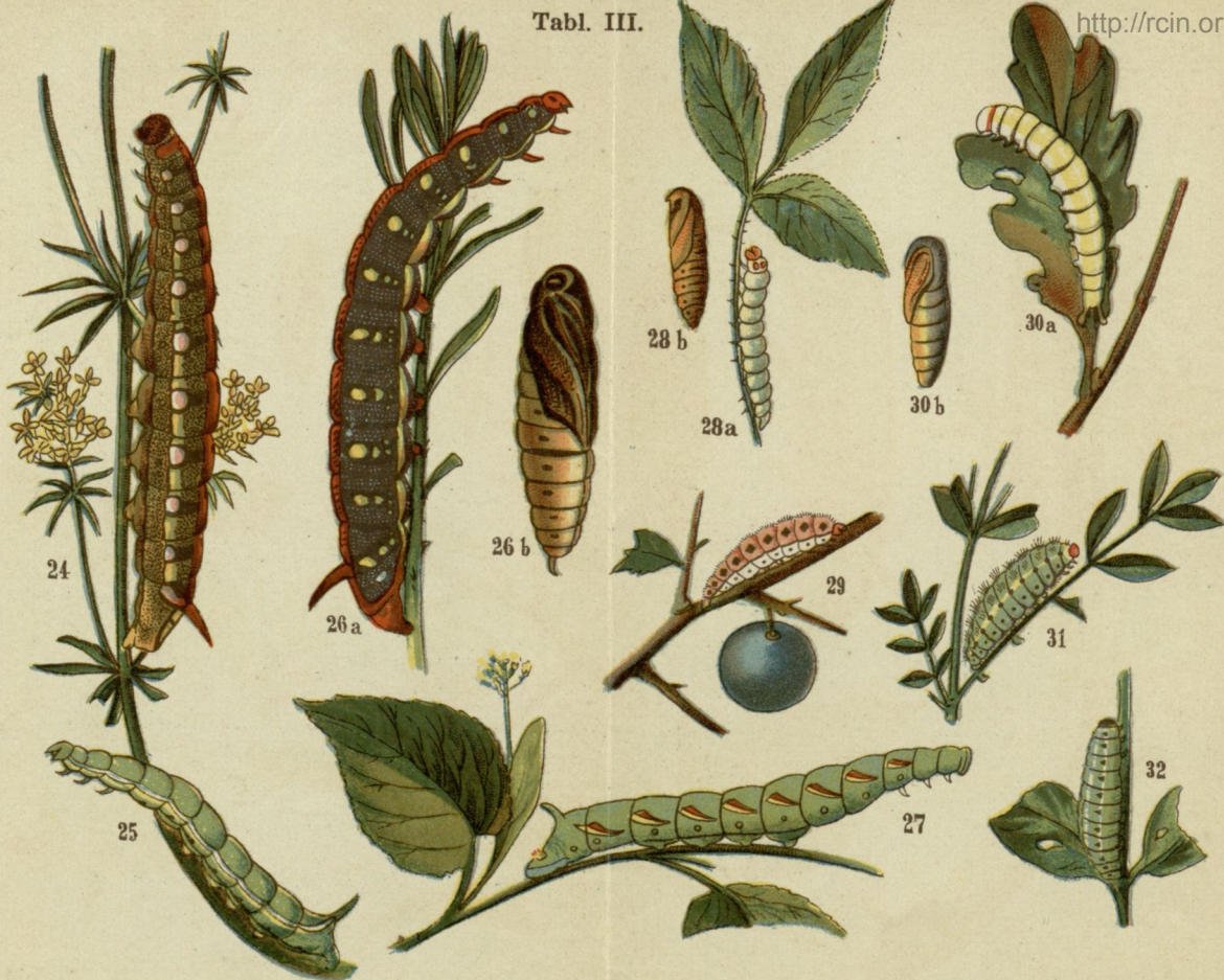
24. Zmrocznik paskowany ( Deilephila livornica ). 25. Fruczak gołąbek czyli gołębi ogon lub gwiazdnik ( Macroglossa stellatarum ). 26. Zmrocznik wilczomleczek ( Deilephila euphorbiae ). 27. Nastrosz lipowiec ( Smerinthus tiliae ). 28. Przeziernik malinowy ( Bembecia hylaeiformis ). 29. Lśniak popielatek (rodzaj) ( Ino pruni ). 30. Ukońnica ( Hylophila prasinana ). 31. Kraśnik (rodzaj) ( Zygaena fausta ). 32. Kraśnik pstrokaty ( Zygaena carniolica ).