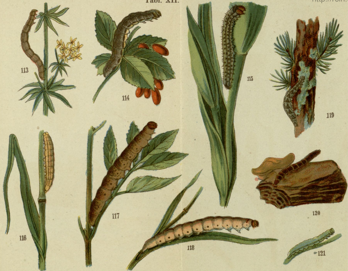
113. Paśnik dwukarbek (rodzaj) ( Larentia galiata ). 114. Mierzchowica (rodzaj) ( Rhizogramma detersa ). 115. Helotropha leucostigma ). 116. Sówka trawnica ( Hadena strigilis ). 117. Piętnówka (rodzaj) ( Memestra serratilinea ). 118. Rolnica (rodzaj) ( Agrotis forcipula ). 119. Łakotnica (rodzaj) ( Aventia flexula ). 120. Hubna sadzówka cz. węglarz ( Boletobia fuliginaria ). 121. Poziłotka pokątnica ( Heliaca tenebrata )