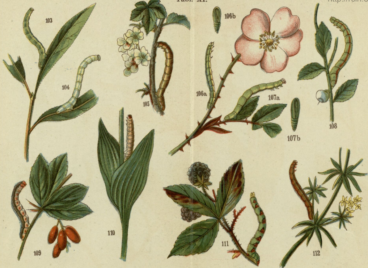
103. Przylatczak (rodzaj) ( Lobophora carpinata ). 104. Przylatczak naosiniak cz. sześciokrzydlak ( Lobophora sexalata ). 105. Pomiernik dziurawczak ( Anaitis plagiata ). 106. Paśnik naróżak ( Larentia fulvata ). 107. Paśnik dwubarwny ( Larentia bicolorata ). 108. Nacinek osiniak cz. topolak ( Lygris populata ). 109. Ukladek szarak ( Eucosmia certata ). 110. Paśnik alpejski (rodzaj) ( Larentia alpicalaria ). 111. Paśnik jeżynowy ( Larentia albicillata ). 112. Paśnik smętniak ( Larentia tristata ).