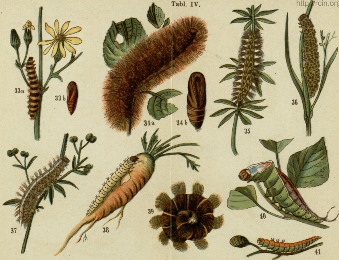
33. Marzymłodka porporzec ( Euchelia jacobaeae ). 34. Krasa rakuska ( Pleretes matronula ). 35. Niedźwiedziówka (rodzaj) ( Arctia casta ). 36. Krasa alpejska. ( Euprepia pudica ). 37. Krasa plamista (rodzaj) ( Arctia maculosa ). 38. Krótkowąs pniówka ( Hepialus sylvinus ). 39. Przędka wrzosowa ( Bombyx rubi ). 40. Widłogonka siwica ( Harpya vinula ). 41. Wycinka brzoźówka czyli Nowik ( Drepana falcataria ).