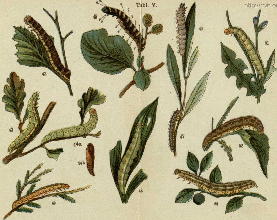
42. Garbatka koziaǳiówka ( Notodonta tremula ). 43. Garbatka sierpówka ( Notodonta chaonia ). 44. Falica dębowa (rodzaj) ( Polyphoca ridens ). 45. Olszówka (rodzaj) ( Acronycta alni ). 46. Wjeżdżka łożówka ( Pygaera curtula ) 47. Wiklinówka ( Pygaera pigra ). 48. Rolnica czyli opaska tasiemka ( Agrotis pronuba ). 49. Rolnica wrzosówka (rodzaj) ( Agrotis strigula ). 50. Okrężtnica ( Polia polymita ). 51. Rolnica mozaikowa (rodzaj) ( Agrotis musiva ). 52. Rolnica kropkowana (rodzaj) ( Agrotis depuncta ).