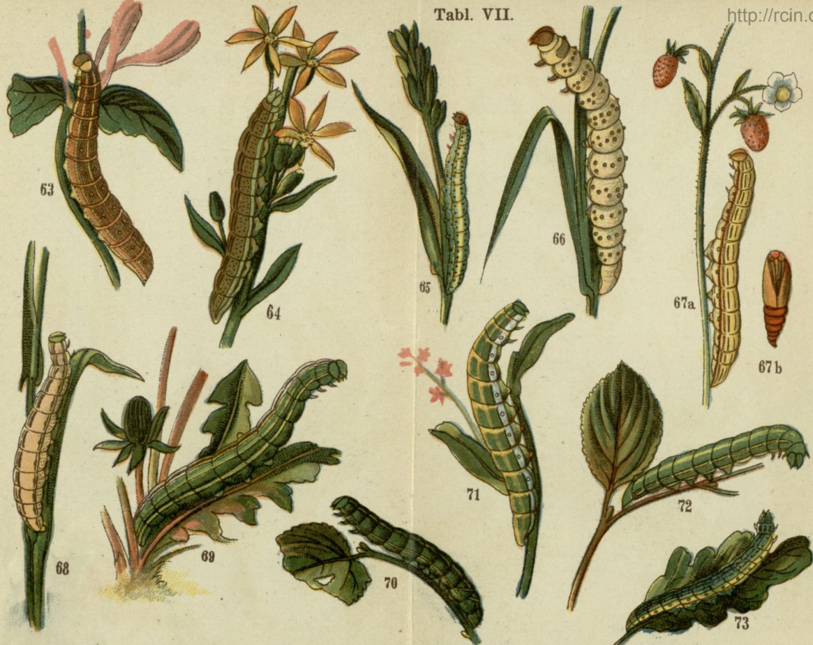
63. Sówka porfirowa (rodzaj) ( Hadena porphyrea ). 64. Bronzówka (rodzaj) ( Hadena adusta ). 65. Sówka (rodzaj) ( Hadena ochroleuca ). 66. Szmardzówka ( Jaspidea celsia ). 67. Mokradlica błednica ( Leucania pallens ). 68. Mokradlica kropkowana (rodzaj) ( Leucania punctosa ). 69. Oplonka płomykówka ( Amphipyra livida ). 70. Oplonka (rodzaj) ( Amphipyra cinnamomea ). 71. Przegibka wiciokrzewka ( Taeniocampa gothica ). 72. Przegibka stalka ( Taeniocampa stabilis ). 73. Przegibka dębica ( Taeniocampa pulverulenta ).