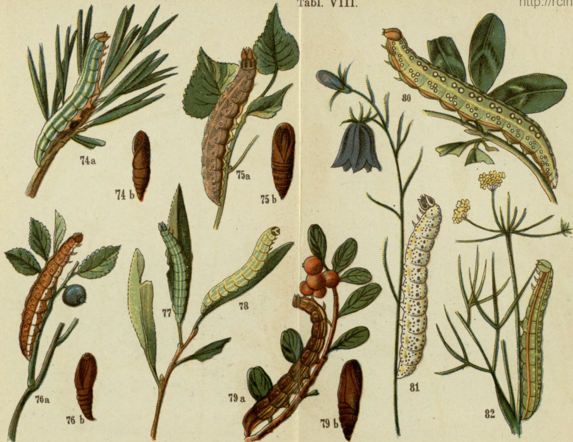
74. Strzygonia choinówka ( Panolis piniperda ). 75. Mesogona oxalina . 76. Zrzenicówka rudawica ( Orthosia helvola ). 77. Kresówka kobielistka ( Plastenis retusa ). 78. Kresówka sokorówka ( Plastenis subtusa ). 79. Błędnicza popielatka (rodzaj) ( Calocampa solidaginis ). 80. Błędnicza trzaska ( Calocampa exoleta ). 81. Kapturnica (rodzaj) ( Cuculia campanulae ). 82. Telesilla amethystina .