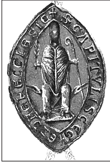
2. KDWlkp., t. 4, tabl. 2, nr LXVII (lit. wyd. I. Zakrzewski)