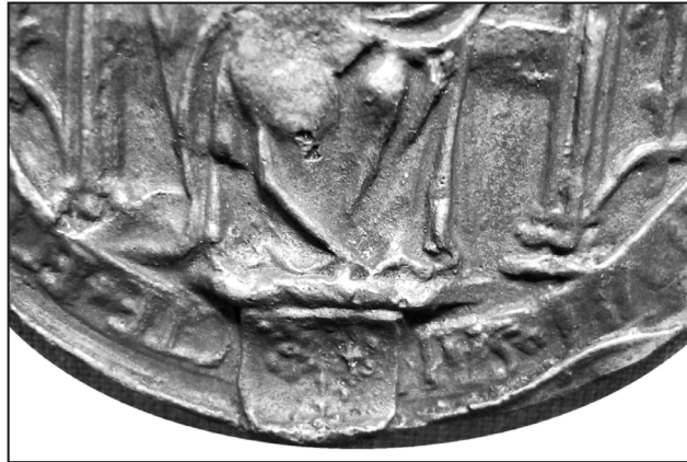
7. odlew: MN Kraków, Dział rękopisów, odl., nr 1533

w Żninie, sygn. 3; tamże, oddział Inowrocław, Akta miasta Żnina, sygn. 3; AA Gniezno, Dypl. Gn: 654 175 , 675 176 , 705, 706, 708 177 , 736 178 , 779 179 , 780 180 , 804 181 , 827, 829 182 , 838 183 , 845, 849 184 , 858 185 , 859, 863, 864 186 , 870 187 , 873, 875 188 , 877, 879, 880, 1044, 1224 189 ; AGAD Warszawa, dok. pap., sygn. 3131, 4256 190 ; B.Czart., dok. perg., sygn.: 896 191 , 1233 192 .