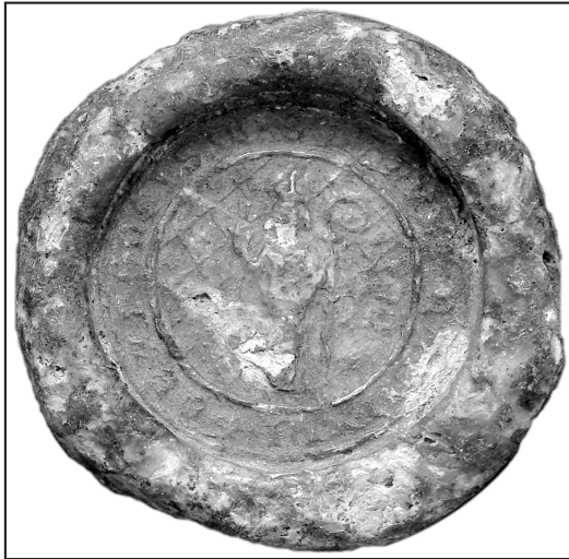
13. or.: AA Gniezno, Dypl. Gn 244