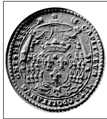
18. kop.: ze zbiorów własnych autora (fot. P. Namiota)