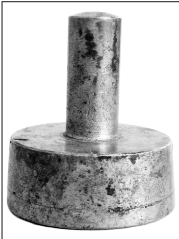
19. tłok: AA Gniezno, Pieczęcie, S. 331