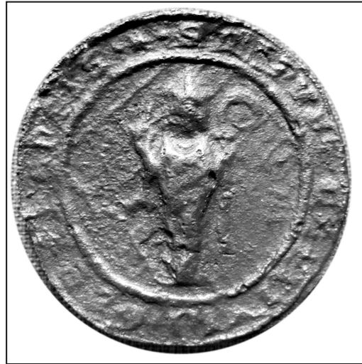
14. odlew: MN Kraków, Dział rękopisów, odl., nr 1576

4) Odlew: AA Gniezno, zbiór odlewów, bez sygnatur 411 (gipsowe); MPPP Gniezno, Zbiór odlewów, sygn.: 146 (gipsowy) 412 ; MN Kraków, Dział rękopisów, odl., nr 1533 413 (galwaniczny).