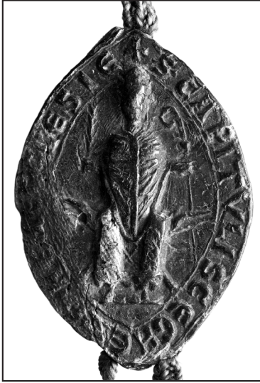
1. or.: AGAD Warszawa, pieczęć luźne, pudło nr 9, sygn. 1