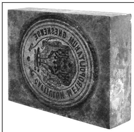
24. tłok: AA Gniezno, Pieczęcie, S. 223