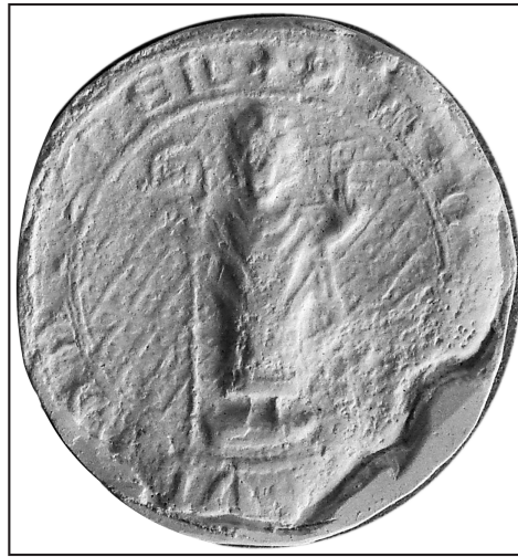
12. odlew: AA Gniezno, zbiór odlewów, bez sygnatur