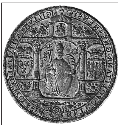
10. tłok: AA Gniezno, Pieczęcie, S. 241