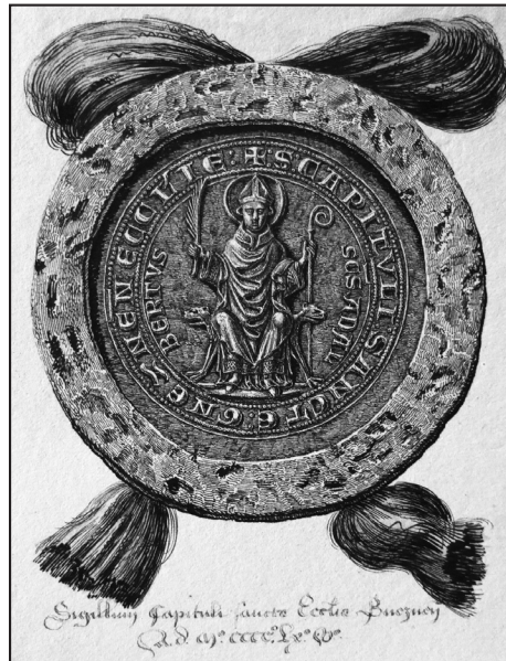
4. rys. K.W. Kielisińskiego, or.: BKóm., Teki Kielisińskiego, Ao IV 348

635 89 , 638, 860 90 , 1167 91 , 1217; GStA PK, XX. HA, PU Schiebl. 75, nr: 25, 28, 32; tamże, Schiebl. 76, nr: 5, 12 92 ; AP Kraków, Zb. Rusieckich, nr 93 93 ; BCzart., rkps 13069, zbiór luźnych pieczęci, nr 161 94 ; AA Poznań, D perg. 37 95 ; AGAD Warszawa, dok. perg., sygn.: 1942, 3549, 3623. Także inny nie znany autorowi z autopsji egzemplarz w: Muzeum Archidiecezji Łódzkiej, dok. perg. sygn. 7 96 .