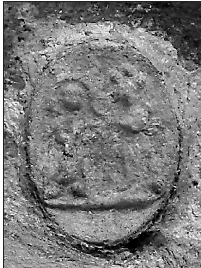
27. or.: AA Gniezno, Dypl: Gn 139