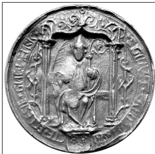
6. odlew: MN Kraków, Dział rękopisów, odl., nr 1533