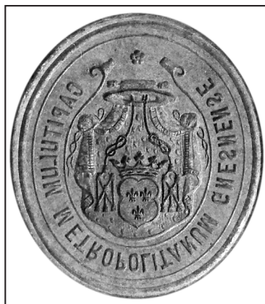
25. tłok: AA Gniezno, Pieczęcie, S. 223