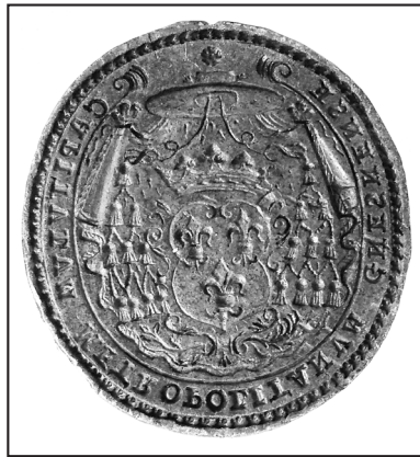
17. tłok: AA Gniezno, Pieczęcie, S. 330