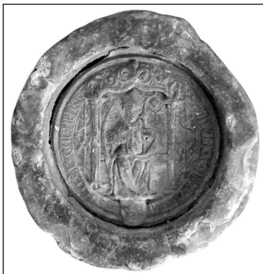
5. or.: AA Gniezno, Dypl. Gn 705