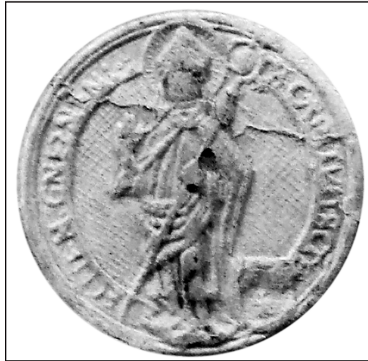
15. or.: AA Gniezno, Dypl. Gn 1033

4) Odlew: MPPP Gniezno, Zbiór odlewów, sygn.: 147 (gipsowy).