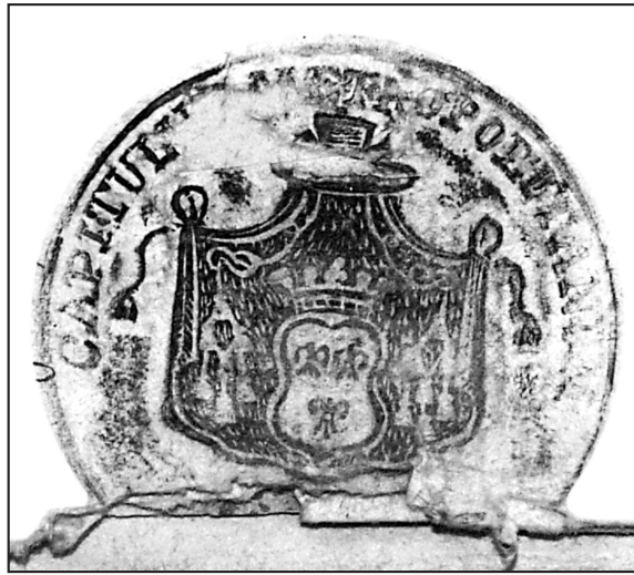
23. or.: AP Bydgoszcz, Akta rejencji bydgoskiej IIa/907 (bez paginacji)