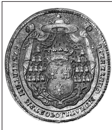
20. tłok: AA Gniezno, Pieczęcie, S. 331