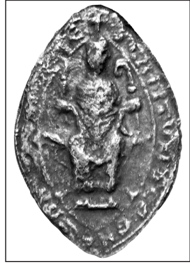
3. odlew: MN Kraków, Dział rękopisów, odl., nr 34 (fot. P. Pokora)