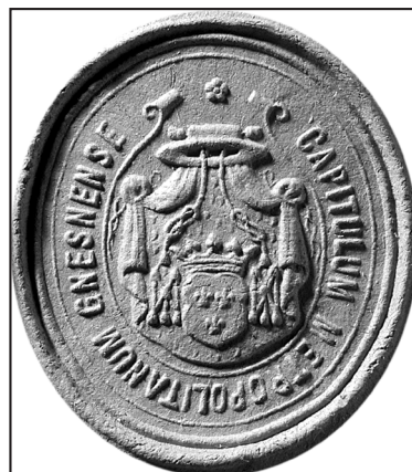
26. kop.: