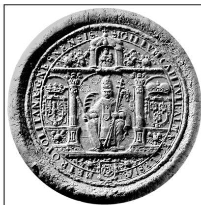
11. kop.: