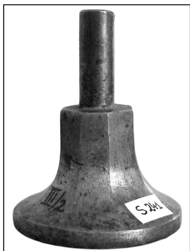
9. tłok: AA Gniezno, Pieczęcie, S. 241