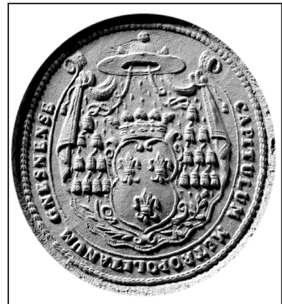
21. kop.: ze zbiorów własnych autora (fot. P. Namiota)