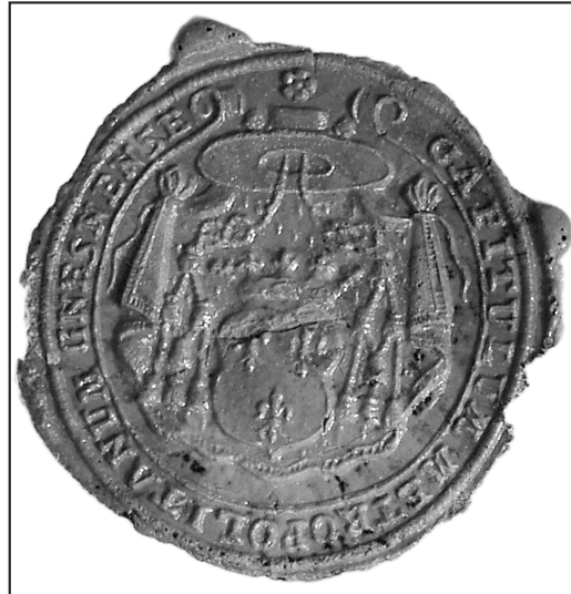
22. or.: AP Bydgoszcz, Akta rejencji bydgoskiej IIa/928 (bez paginacji)