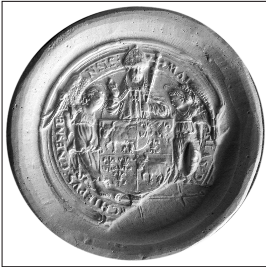
8. odlew.: AA Gniezno, CS Drzewiecki 1

wiana pieczęć kapituły z jej herbem, zachowana w najwcześniejszym egzemplarzu przy dokumencie z 1521 r. 304 Powyższy przegląd, choć dość pobieżny, uświadamia, jak mało wiadomo o genezie herbu kapituły gnieźnieńskiej, i to pomimo, że katedra gnieźnieńska doczekała się nawet własnego herbarza 305 . Wciąż słabo rozpoznane są najwcześniejsze źródła heraldyki kapituły gnieźnieńskiej, których brak dotkliwy jest najbardziej dla okresu od schyłku XIV w. do początku lat 70-tych XV w. 306 Herb kapituły gnieźnieńskiej bardzo późno trafia na pieczęcie arcybiskupie. Dopiero Maciej Drzewiecki (1531–1537) umieszcza go w polu drugim i trzecim na czteropolowej tarczy obok znajdujących się w polu pierwszym i czwartym wyobrażeń swego herbu rodzowego — Ciołek (fot. 8) 307 .