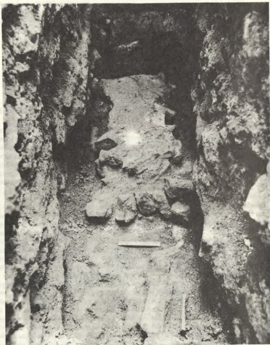
Ryc. 1. Kraków-Wawel. Dziedziniec Batorego. Wykop 1/86. Relikt muru przedromańskiego w korytarzu łaźni renesansowej