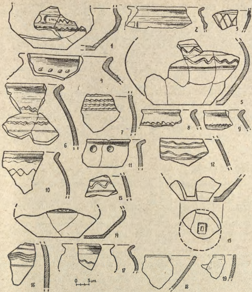
Ryc. 2. Radłów, pow. Oława. Ceramika z wypełniska domu 1/1966