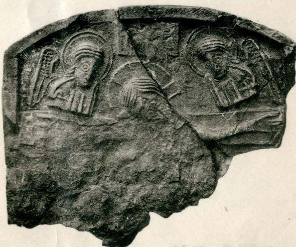
Каменные и глиняныя иконы княжеской эпохи.