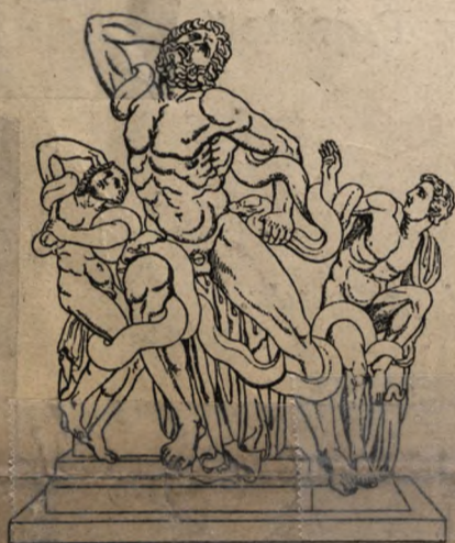
Grupa Laokoona. Rzym.

Sztuką interesujemy się wszyscy. Karmią się nią rozmowy towarzyskie, na wystawach pełno ciekawych. Nowy obraz, nowa rzeźba są przedmiotem ogólnego zajęcia. Daje się zauważyć prąd estetyczny, który, sięgając coraz szerzej, ogarnia już potrzeby życia codziennego. Nawet przemysł i rzemiosła troszczą się o „stosowanie” sztuki do swoich wyrobów, czyli o nadawanie im piętna artystycznego. W tych warunkach jest też dziś niezawodnie chwila stosowna do wydania po polsku dzieła, zawierającego pełny obraz dziejów sztuki , ilustrowany reprodukcjami arcydzieł . Dzieła takiego dotychczas nie mieliśmy , i zdaje się, że redakcja „Gazety Polskiej” wydając je dla swoich prenumeratorów, uczyni zadość potrzebie, odczuwanej w kołach bardzo szerokich.