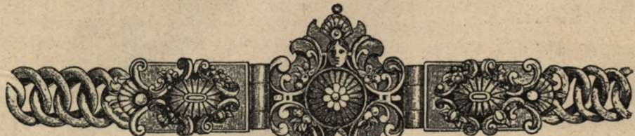
Opaska z czasów

Z temi uczuciami stajemy na progu Nowego Roku, aby dalej prowadzić wątek pracy publicystycznej.