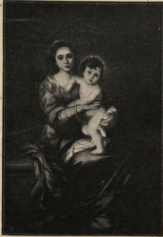
Murillo. Madonna z dzieciątkiem. Florencya. Galerya Pitti.