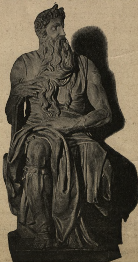
Michał Anioł Buonarroti. — Mojżesz.

Na pierwszej stronie przed tekstem: wiersz petitu kop. 30. Na trzeciej stronie (reklamy): wiersz petitu kop. 15. Na czwartej i dalszych stronach ogłoszenia zwyczajne: wiersz petitu pierwszy raz kop. 10, następnie po kop. 8.