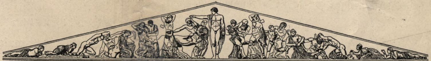
Fronton świątyni Zeusa w Olympii.

w dniu powszednie popołudniu, a w Niedziele i święta rano.