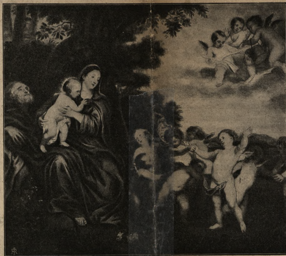
A. Van Dyck. N. M. P. w drodze do Egiptu. Florencia. Galeria Pitti.

Dla osób nieprenumerujących „Gazety Polskiej” cena zeszytu „Historii sztuki” kop. 25, z przesyłką pocztową kop. 35, a cena całego dzieła 20 rubli.