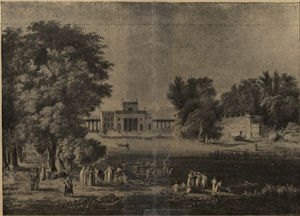
Eazienki na początku XIX wieku (Podeją obrazu malowanego a la gouache przez niewiadomego artystę około 1808 r., w posiadaniu J. Wrotnowskiego).

TOM VI. Konfederacya targowicka.—Twórcy konfederacyi.—Charakterystyka Szczęsnego Potockiego.—Najjaśniejsza Konfederacya Generalna.—Użyte przez nią środki przymusu.—Rozporządzenia, dotyczące prasy i wychowania publicznego.—Opór wojska, szlachty, bunt włościan.—Stosunki z komendą rosyjską.—Bitwa pod Raclawicami.—Uzbrojenie województw południowych.—Sejm skonfederowany Grodzieński.—Rząd powstańczy z 1794 r.—Dyktatura Kościuszkowa.—Sposób obliczenia sił zbrojnych Kościuszkowa.—Dyktatura Grochowskiego.—Korpusty, przybyłe z kordonu rosyjskiego.—Bitwy Chelmska i Szczekocińska.—Stan arsenału i garnizonu Warszawskiego.—Epoka oblężenia Warszawy.—Działania wojska nad Narwią.—Bitwy pod Stonimem i Krupczycami.—Działania wojenne na Żmudzi.—Początek powstania Wielkopolskiego.—Zwinięcie oblężenia Warszawy.—Marsz Suworowa.—Nowy rozkład korpusty.—Kłeska Sierakowskiego.—Siły powstańcze w Warszawie.—Wyprawa Kościuszkowa pod Maciejowicami.—Opis i plany bitwy pod Maciejowicami.—Wzięcie Kościuszkowa do niewoli.—Wawrzecki Naczelnikiem Najw.—Ostatnie wysilenia.—Kłeska nad Narwią.—Szturm Pragi.—Kapitulacya Warszawy.—Zamknięcie.