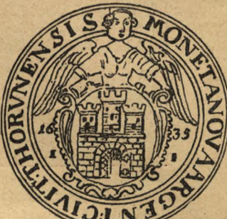
Dawne polskie talary (Zit. 8 gr. 24).