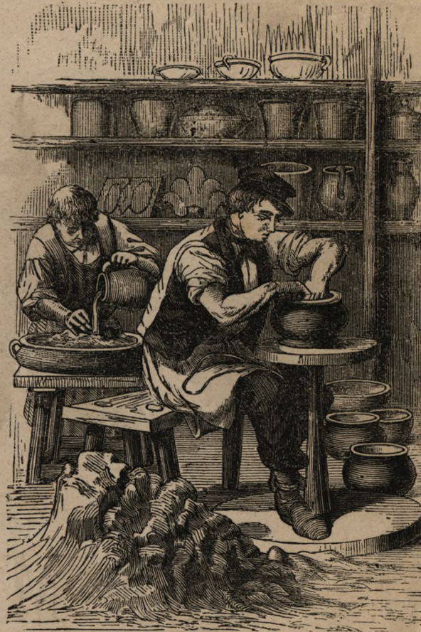
Fabryka cya porcelany.