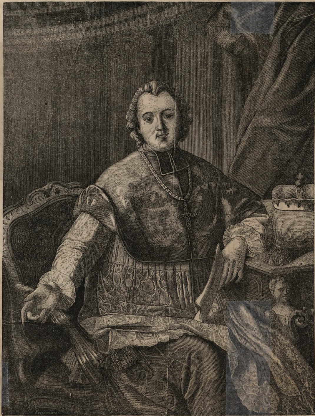
Ignacy Krasicki bajkopisarz.