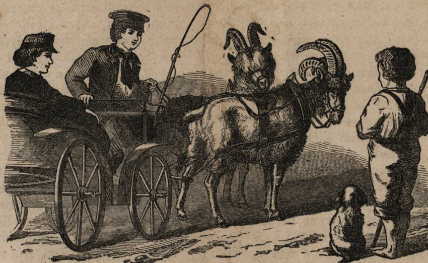
Zaprząg w kozłów.