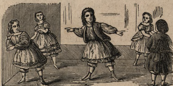
Cztery kąty a pięć piątą.