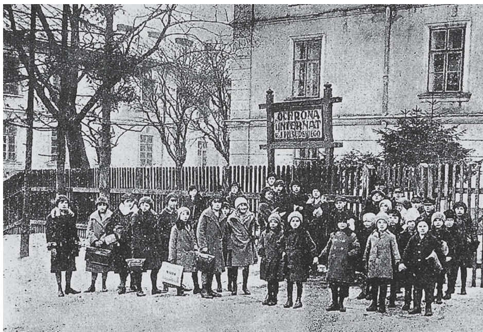
Fotografia 2. Budynek i podopieczni ochronki i internatu przy ul. Jabłonowskich 7