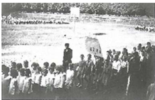
Fot. 2. Półkolonie MKOP we Lwowie