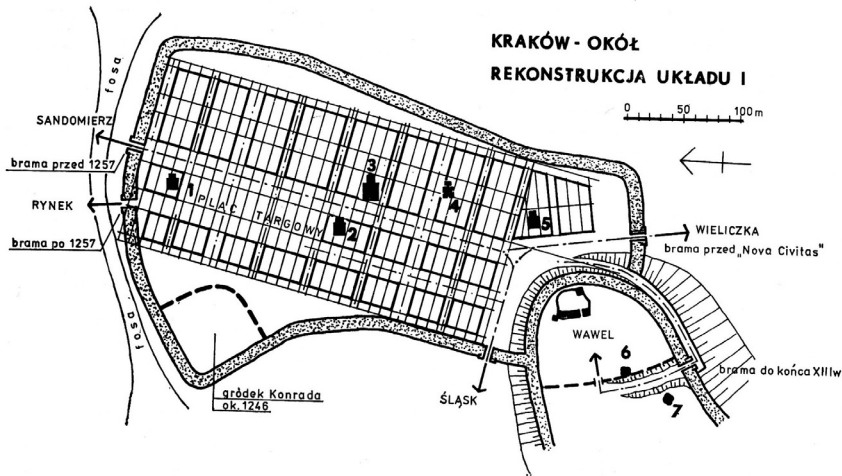
12. Okół — rekonstrukcja teoretyczna układu I, 1 poł. XIII w. (oprac. W. Niewalda)

historyczno-urbanistycznych. Na ich gruncie Waldemar Niewalda i Bogusław Krasnowolski wyróżnili dwa hipotetyczne plany urbanistyczne na wawelskim podgrodzium 17 . Starszy układ zabudowy (il. 1) został przez nich zidentyfikowany w południowej części podgrodzia, przy czym pierwotnie miał on obejmować cały jego obszar. Zgodnie z tą koncepcją północna część układu uległa niwelacji w wyniku kolejnej regulacji urbanistycznej, spowodowanej lokacją Łokietkowego nowego miasta. Starsze rozplanowanie podgrodzia miało zostać wytyczone w formie układu ulicowo-pasmowego, mniej więcej wzdłuż ul. Grodzkiej. Według Niewaldy i Krasnowolskiego powstało ono w pierwszej połowie XIII w., na etapie pierwszej lokacji Krakowa, przypisywanej w historiografii powszechnie Leszkowi Białemu 18 . Dodajmy, że interpretację, zgodnie z którą pierwsza krakowska gmina lokacyjna zajęła teren wawelskiego podgrodzia, sformułowała Maria Borowiejska-Birkenmajerowa 19 .