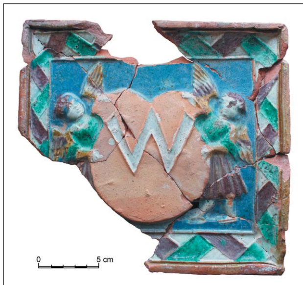
Ryc. 2. Kafel z zamku w Rokanciszkach z gasztoldowskim herbem Awdaniec

Kolejną grupą źródeł umożliwiających poznanie stanu zachowania, wyglądu, rozplanowania przestrzennego i funkcjonalnego zamków są inwentarze. Sporządzono je po 1542 r., gdy inwentaryzowano majątek ostatniego z Gasztoldów w związku z przejściem go przez wielkiego księcia 41 . Na podstawie zamieszczonych tam opisów uzyskujemy informacje o zabudowaniach określanych jako stare lub wymagające naprawy, których powstanie zapewne należy wiązać jeszcze z czasami Gasztoldów.