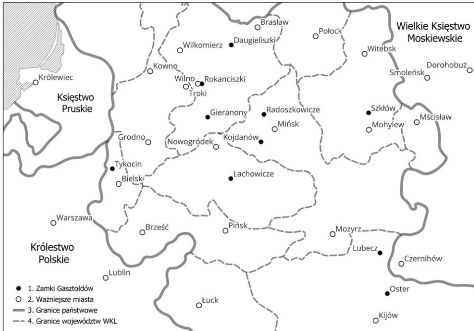
Ryc. 1. Lokalizacja zamków Gasztołdów w Wielkim Księstwie Litewskim (oprac. M. Volkau)

nych obiektów można jeszcze dodać te znajdujące się w: Daugieliszkach (ob. Senasis Daugēliškis na Litwie), Kojdanowie (ob. Dżarżynsk na Białorusi), Ostrze (ob. Oster w Ukrainie), Szklowie (ob. Szklou na Białorusi) i Dorohobużu (ob. Dorogobuż w Rosji). Ten ostatni jeszcze przed rokiem 1500 został przejęty przez Moskwę, dlatego nie będzie brany pod uwagę w dalszych rozważaniach (ryc. 1) 13 .