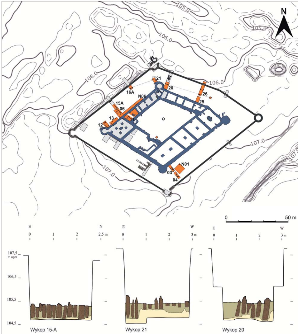
Ryc. 6. Tykocin. Lokalizacja wykopów archeologicznych z relikwiami drewnianych konstrukcji zamku gasztołdowskiego (kolor żółty) odsłoniętych w czasie badań w latach 2001–2007.

Poniżej widok częstokołu w wybranych wykopach (oprac. W. Bis)