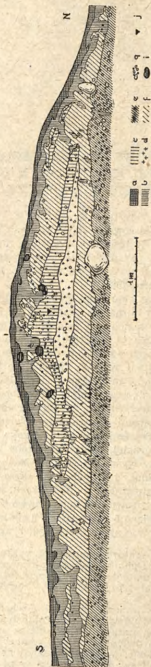
Ryc. 1. Racibórz-Obora. Kurhan 14. Profil kurhanu wzdłuż linii N—S:

a — humus współczesny; b — podglebie; c — jasny piasek przemieszany ze żwirem; d — warstwa ciałopalenia; e — piasek brunatny; f — warstwowany żwir calcowy; g — kamienie; i — korzenie; j — fragmenty naczyń