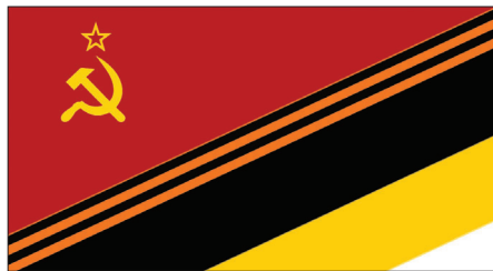
3. Flaga ochotników z ruchu „Esencja Czasu” walczących na Ukrainie