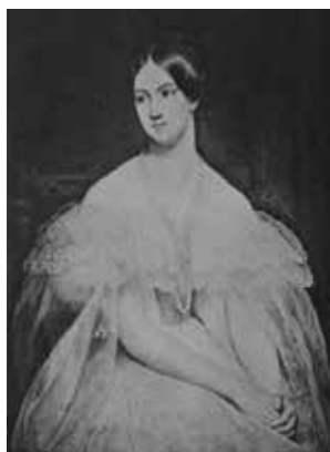
1. Delfina Potocka

D la historyka literatury romans między Delfiną Potocką a Zygmuntem Krasińskim to przede wszystkim ogromny zbiór listów – pisanych okresami tak często, że stanowiących rodzaj dziennika. Słowa wypełniały czas rozdzielenia kochanków. Chwile spędzane razem są w zasadzie opieczętowane milczeniem. Miejsca spotkań, trasy wspólnych podróży, drogi przebyte ku sobie – ponieważ kochankowie, dla niepoznaki i uniknięcia (i tak nieuniknionych) plotek, przybywali na umówione rendez-vous z różnych stron – kreślą mapę tego niezwyklego romansu. Niektóre z odwiedzanych miejsc, jak Fryburg, Sorrento, Varenna, pełniły rolę osi krystalizacji „mitologii” osobistej czy też prywatnego systemu symbolicznego Krasińskiego (Sorrento stało się przecież pseudonimem Delfiny).