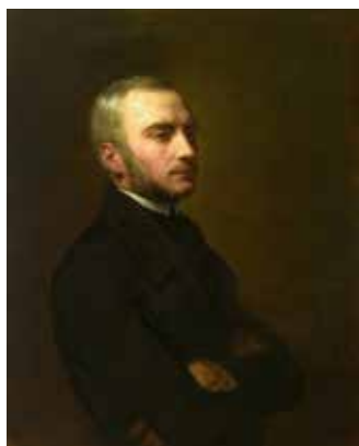
2. Zygmunt Krasiński