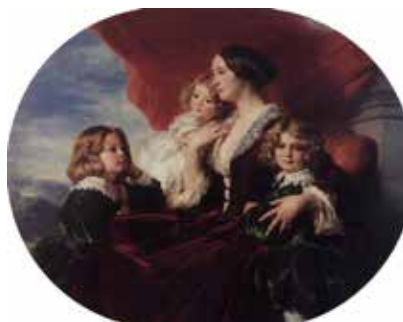
4. Eliza Krasińska z dziećmi