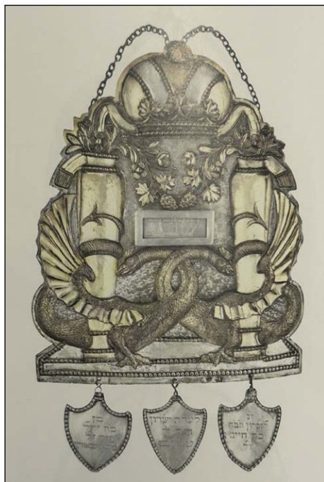
Ryc. 7. Tarcza na Torę z zawieszkami dedykacyjnymi, 1828 r., Muzeum Żydowskie w Pradze.

Fig. 7. Torah shield with dedicatory pendants, 1828, The Jewish Museum in Prague.