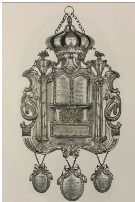
Ryc. 8. Tarcza na Torę z zawieszkami dedykacyjnymi, 1801 r., Muzeum Żydowskie w Pradze.

Fig. 8. Torah shield with dedicatory pendants, 1801, The Jewish Museum in Prague.