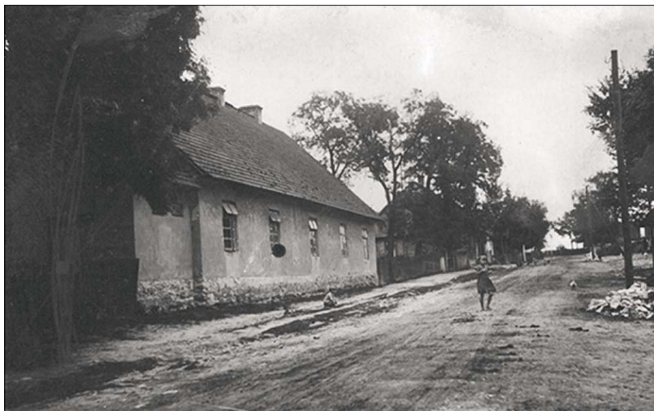
Ryc. 2. Szpital gminny w Maluszynie.