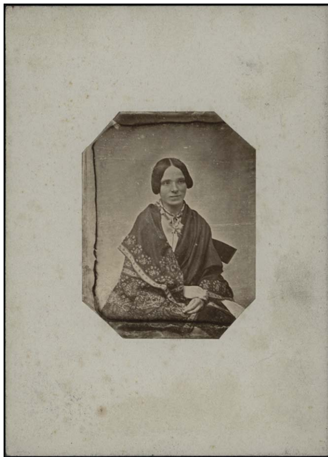
Ryc. 1. Helena Karolina z hrabiów Morsztynów Ostrowska (1815–1892).