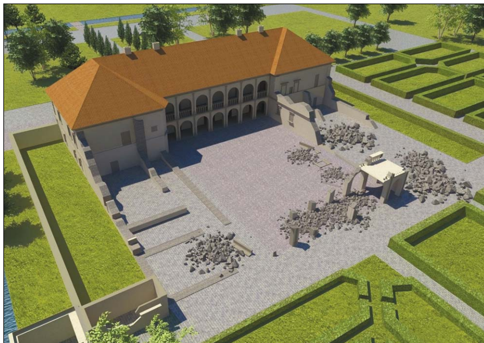
Ryc. 2. Rekonstrukcja wyglądu rezydencji łobzowskiej po rzekomej odbudowie przez Jana III Sobieskiego wg P. Pikulskiego; źródło: Pikulski P. 2019, s. 93