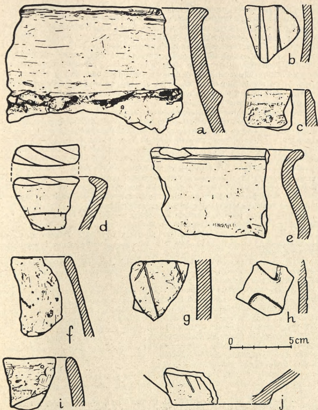
Ryc. 2. Grabice, pow. Lubsko:

a, e — stan. 2 z powierzchni; d — jama 4; f — jama 2; b, c, j, g, i — stan. 1, z warstwy kulturowej; h — stan. 1, z powierzchni