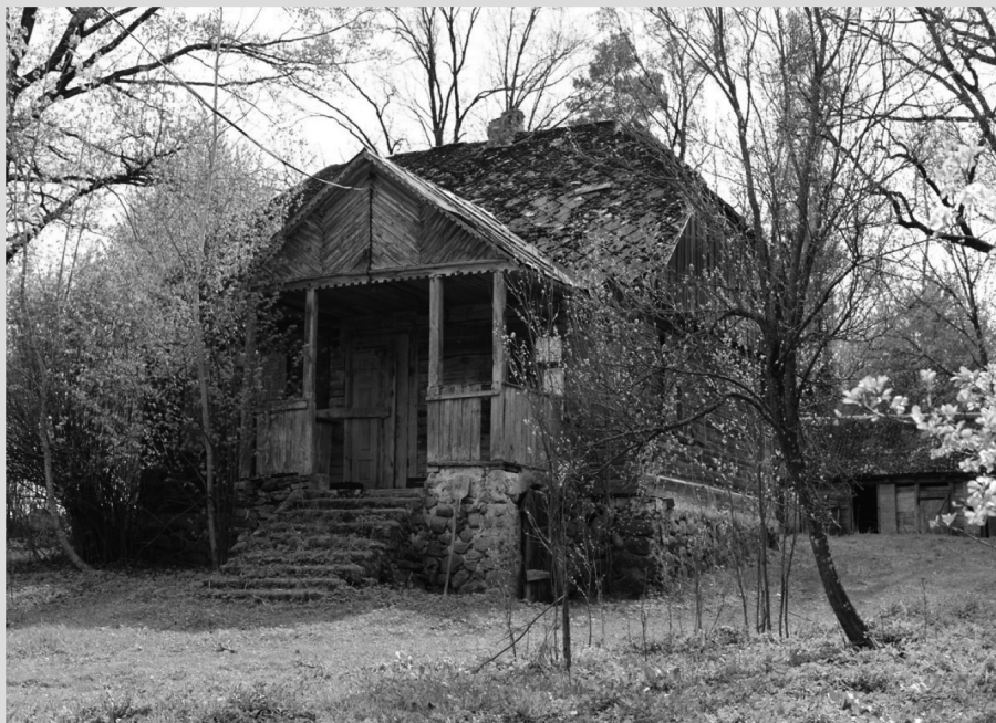
Dom wybudowany przez rodzinę kurpiowską w latach trzydziestych XX w., położony w Dubnicy Kurpiowskiej (kolonia wsi Wołyńce, gmina Kuźnica). Fotografia współczesna z prywatnej kolekcji Katarzyny Zabłockiej.