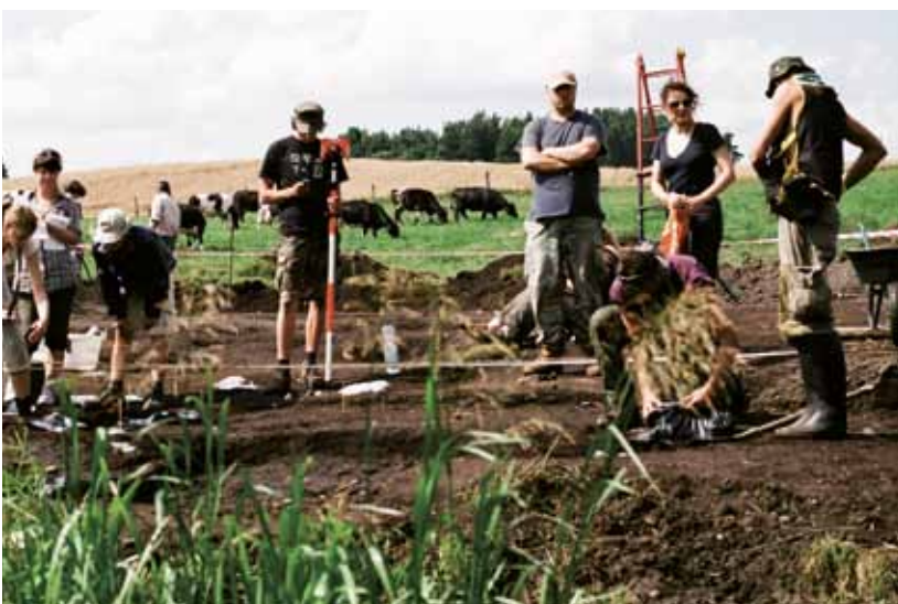
Prace na stanowisku w Cząszkowie 2010-2012 Digging in the field in Cząszkowo 2010-2012

Militaria and parts of belts predominated among the finds. Mostly corroded fragments of iron spearheads, knives and swords were typical, whereas pieces of presumably Roman armor and a sword bead counted among the unique finds. Several imports were special in the assemblage, particularly two elements of a gold parade sword, that is, gold fittings of a sword and scabbard with ornaments including zoomorphic images (lions, birds, dolphins) and plants. A unique silver-gilt figure of a vulture attached to an iron ferrule is suggestive of a military or clan standard. The eyes of the bird were executed in niello technique with copper irises. The finds included a series of sumptuous silver-gilt elements of warrior's belts and horse harnesses, appliqués and openwork ornaments with niello decoration, bearing images of, although not exclusively, animals. A mythical bestiarium populating big, precisely made fittings is an entirely unique find. One large appliqué with palmette finial bears the image of a hippocamp, the palmette composed of five pairs of, alternately, golden and silver bird heads and fan-shaped ending, evidently referring to the "tree-of-life" motif. A large silver fitting with five gilded images of mythical creatures: dolphin, capricorn, two griffins and dragon, is another unique find unparalleled in the archaeological record. The make-up of the deposit testifies to the practice of a special warrior's cult, which has not been recorded so far in Polish territories.