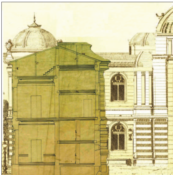
Ryc. 3. Rekonstrukcja fragmentu elewacji podwórzowej ratusza z przekrojem poprzecznym skrzydła bocznego. Widoczne różnice w wysokości traktów — frontowego i podwórzowego (oprac. M. Górzyński na podstawie archiwalnych fotografii oraz szkiców projektowych ratusza w Kaliszu ze zbioru kartograficznego AGAD, sygn. 495-212, ark. 1)

Fig. 3. A reconstruction of the backyard elevation of the town hall with a cross-section of the side wing. There are visible differences in the height of the front and back sections of the building (prepared by M. Górzyński on the basis of archival photos and design sketches [from the cartographic collection of AGAD, cat. no. 495-212, sheet 1])