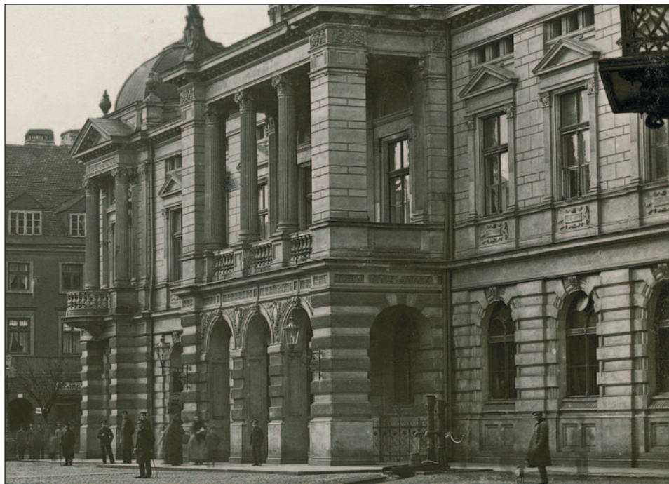
Ryc. 4. Gmach ratusza kaliskiego, detale elewacji głównej, fot. W. Boretti, ok. 1900 r. (cyfrowa rekonstrukcja fotografii z kolekcji M. Hertmanna w Kaliszu, fragment)