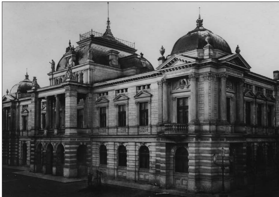
Ryc. 2. Fotografia gmachu ratusza kaliskiego. Widok od północnego-wschodu. Przykład fotografii architektury umiejętnie kadrującej przedstawienie budynku jako obiektu odizolowanego od otoczenia, fot. W. Boretti, ok. 1913 r. (Narodowe Archiwum Cyfrowe, sygn. 1-U-1953)

pozycje postrzegania kultury materialnej 43 . Socjolodzy np. zwrócili uwagę na sprawczość przedmiotów w tworzeniu, przekształcaniu czy utrzymywaniu relacji społecznych i samej kultury, interakcje społeczne są bowiem stymulowane i kształtowane przez obiekty, w tym budynki. Jak przekonuje Tim Dant (m.in. na przykładzie współdziałania surfera i deski do windsurfingu), artefakty materialne to nośniki znaczeń, które biorą aktywny udział w ich kreowaniu, w afektywny sposób wpływają na naszą percepcję, umożliwiając działania i współtworząc podmiotowość 44 .