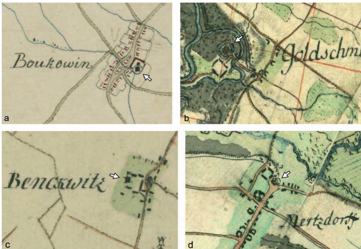
Ryc. 1. Plany wsi z lokalizacją obiektów obronno-rezydencjonalnych wg XVIII-wiecznych map Ch.F. Wredego (a) i L.W. Reglera (b-d): a) Bukowina; b) Złotniki; c) Bieńkowiec; d) Marcinkowice (Staatsbibliothek Berlin, Preußischer Kulturbesitz, sygn. N 1506, N 15140)