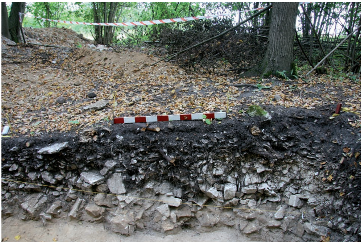
Ryc. 8. Borownia. Segment A. Wykop krzyżowy I/2017. Część wschodnia. Pierwsze trzy metry (1-3) profilu N. Przekrój przez hałdę gruzu wapiennego. Struktura gruzu wskazuje, że szyby zagłębiały się w skałę wapienną.

Widać również, że mogą być to dwie stykające się warpie sąsiednich szybów. Skala 1 m.