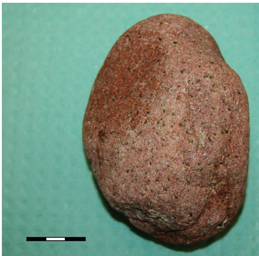
Ryc. 15. Borownia. Kopalnia krzemienia. Tłuczek kamienny z plejstoceńskiego narzutowca ze śladami używania. Fig. 15. Borownia. Flint Mine. Hammerstone made of Pleistocene erratic with traces of use.