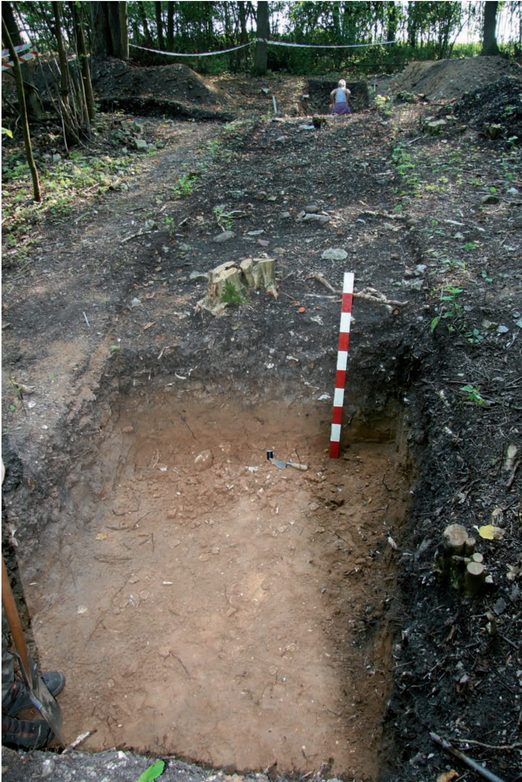
Ryc. 11. Borownia. Segment A. Wykop krzyżowy I/2017. Część zachodnia. Widok w górę stoku, z końca wykopu w kierunku E. Na pierwszym planie profil E słabo widocznej małej jamki i miejsce zebrania węgla drzewnych (Poz-95439). Powyżej widać skupienie tłuczków kamiennych z metra 6 (por. ryc. 10). W górze ujęcia widoczna część wschodnia wykopu (por. ryc. 8 i 9). Skala 1 m.

Fig. 11. Borownia. Segment A. Cross-shaped trench I/2017. Western part. View up the slope, from the end of the trench facing E. In the foreground section E of poorly visible small pit and the place where charcoal is collected (Poz-95439). Above one can see a cluster of stone hammers from metre 6 (see Fig. 10). In photo's upper section the eastern part of the trench is visible (see Figs. 8 and 9). Scale 1 m.