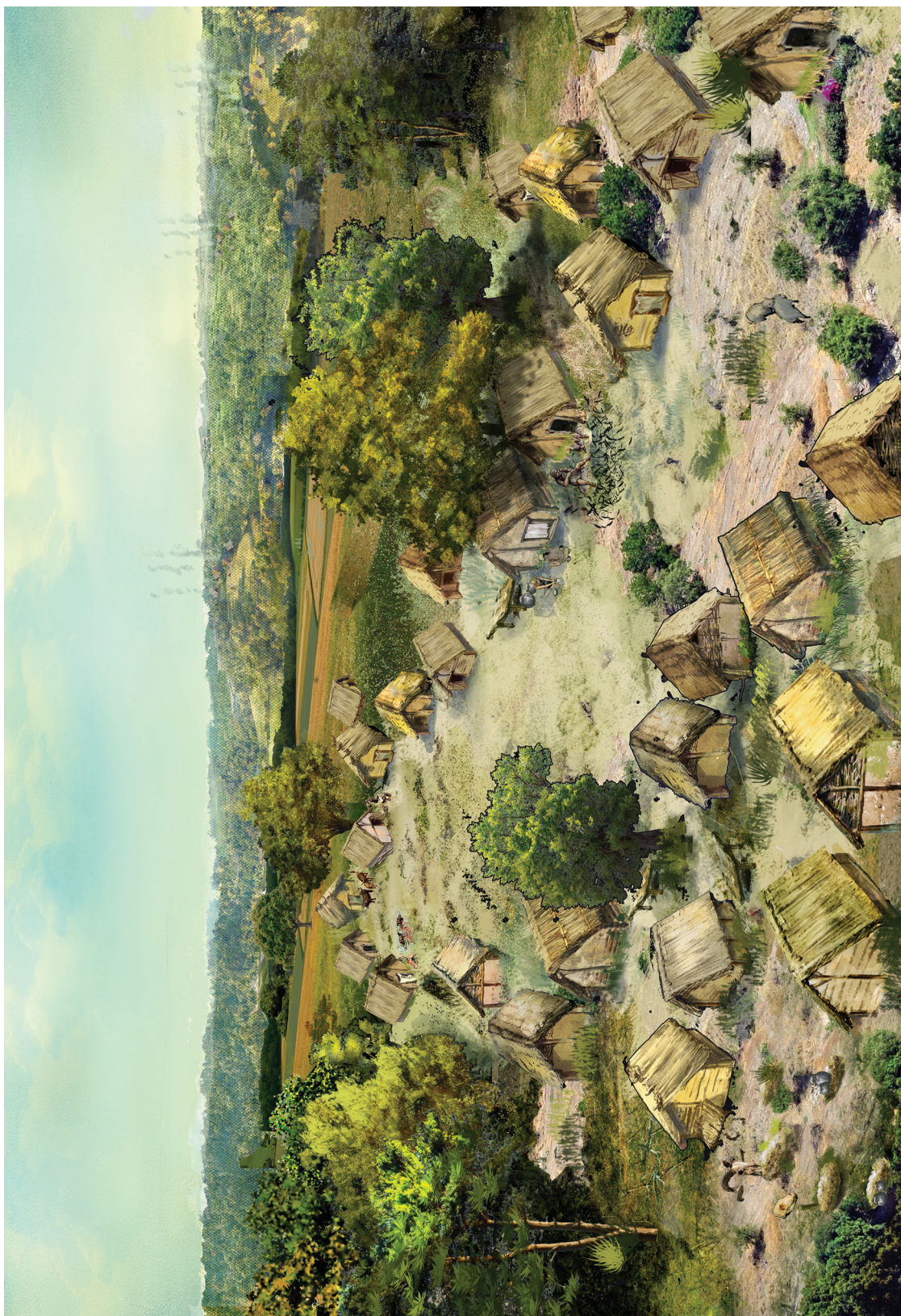
Ryc. 22. Mierzanowice. Wizualizacja osady (domy i spichrze) z cmentarzem (lewy dolny róg) z wczesnej epoki brązu na tle krajobrazu wyżyny lessowej nad rzeczką Gierczanka. Przygotował Tymoteusz Piotrowski według koncepcji J. Lecha