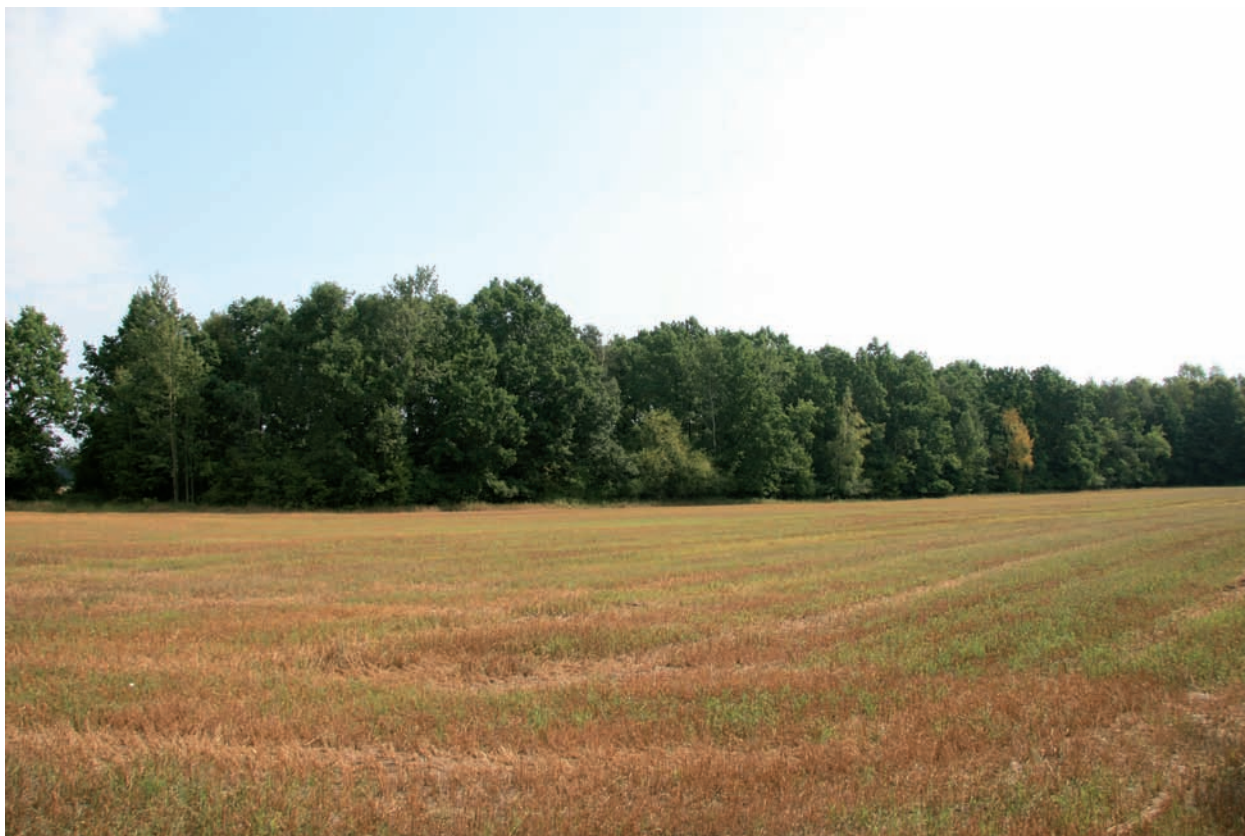
Ryc. 6. Borownia. Sierpień 2017 r. Widok z południowego zachodu na segment D prehistorycznej kopalni krzemienia (por. ryc. 4). Wykop II znajdował się po prawej stronie segmentu, niedaleko od prawego skraju pasa drzew. Fig. 6. Borownia. August 2017. View from the southwest to segment D of the prehistoric flint mine (see Fig. 4). Trench II was located on the right side of the segment, not far from the right edge of the tree belt.

wykopu i prowadzenie badań wymagało wycięcia leszczyny na obszarze ponad czterech arów. Jest to teren obniżony w stosunku do wyniesionego pola górniczego o zachowanym krajobrazie pokopalnianym od strony południowej oraz do mniej wyniesionego pola ornego od strony północnej. Właśnie ten fragment pola górniczego Borowni, położony na początku stoku doliny Kamiennej, zwrócił jako pierwszy uwagę S. Krukowskiego (1921, 159, Rys. 10, 163; 1922, 45) i J. Samsonowicza (1923, 23).