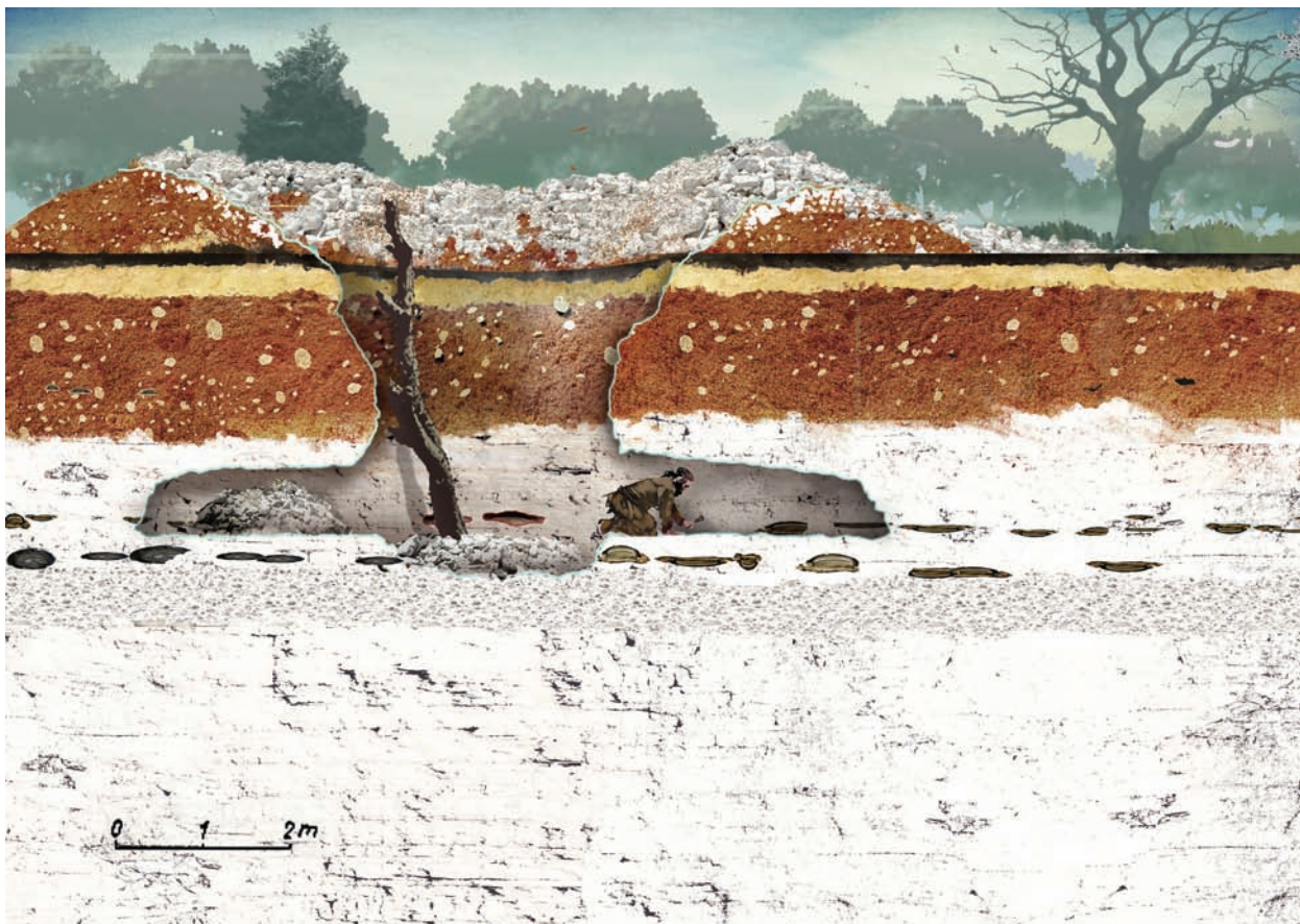
Ryc. 20. Borownia. Wizualizacja jednego z przypuszczalnych typów szybu z segmentu A kopalni krzemienia w trakcie eksploatacji we wczesnej epoce brązu. Przygotował Tymoteusz Piotrowski według koncepcji J. Lecha. Wg Krzemionki 2018, 123, Fig. 93

Fig. 20. Borownia. Visualization of one of the supposed types of shaft from segment A of the flint mine during exploitation in the early Bronze Age. Prepared by Tymoteusz Piotrowski according to the concept of J. Lech. After Krzemionki 2018, 123, Fig. 93