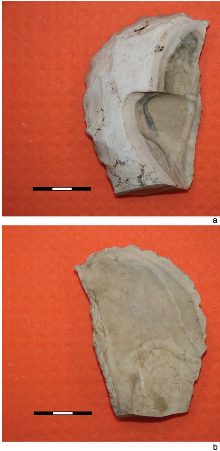
Ryc. 16. Borownia. Kopalnia krzemienia. Wykop I – krzyżowy, część S. Nóż odlupkowy typu „Zełe”. Okaz spatynowany; a – strona górna; b – widok z drugiej strony. Fig. 16. Borownia. Flint Mine. Trench I – cross-shaped one, part S. ‘Zełe’ type flake knife. Specimen patinated; a – upper side; b – view from the other side.