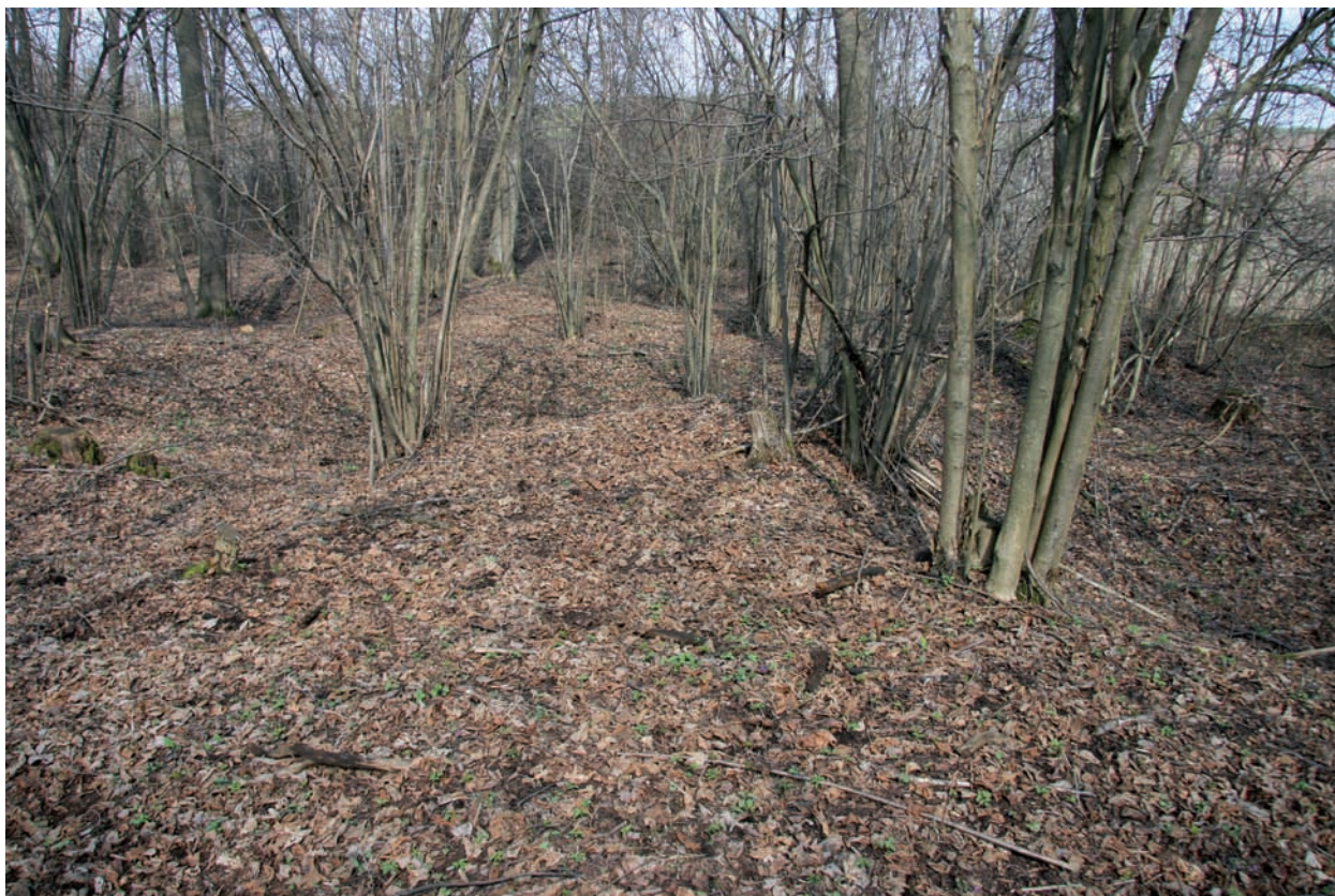
Ryc. 1. Borownia, pow. ostrowiecki. Przedgórze Ilżeckie. Prehistoryczne pole górnicze nad doliną rzeki Kamienna. Segment A. Początek kwietnia 2009 r.