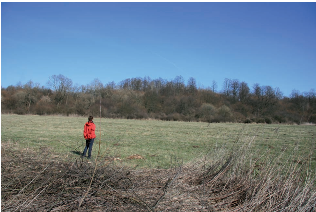
Ryc. 3. Borownia, pow. ostrowiecki. Dolina rzeki Kamienna poniżej kopalni. Widok z prawego brzegu na wschód. Na pierwszym planie dolina, bagnista dawniej. Najwyżej położony jest segment A pola górniczego – drzewa pośrodku (por. ryc. 4). Początek kwietnia 2009 r.