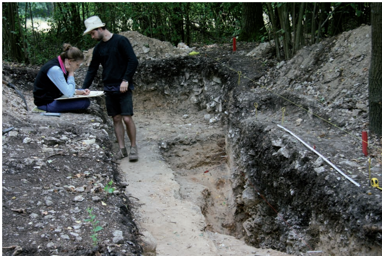
Ryc. 12. Borownia. Segment D. Wykop II. Profil i fragment zarysu górnej części szybu D1 po zakończeniu eksploracji. Skala nad profilem 2 m.