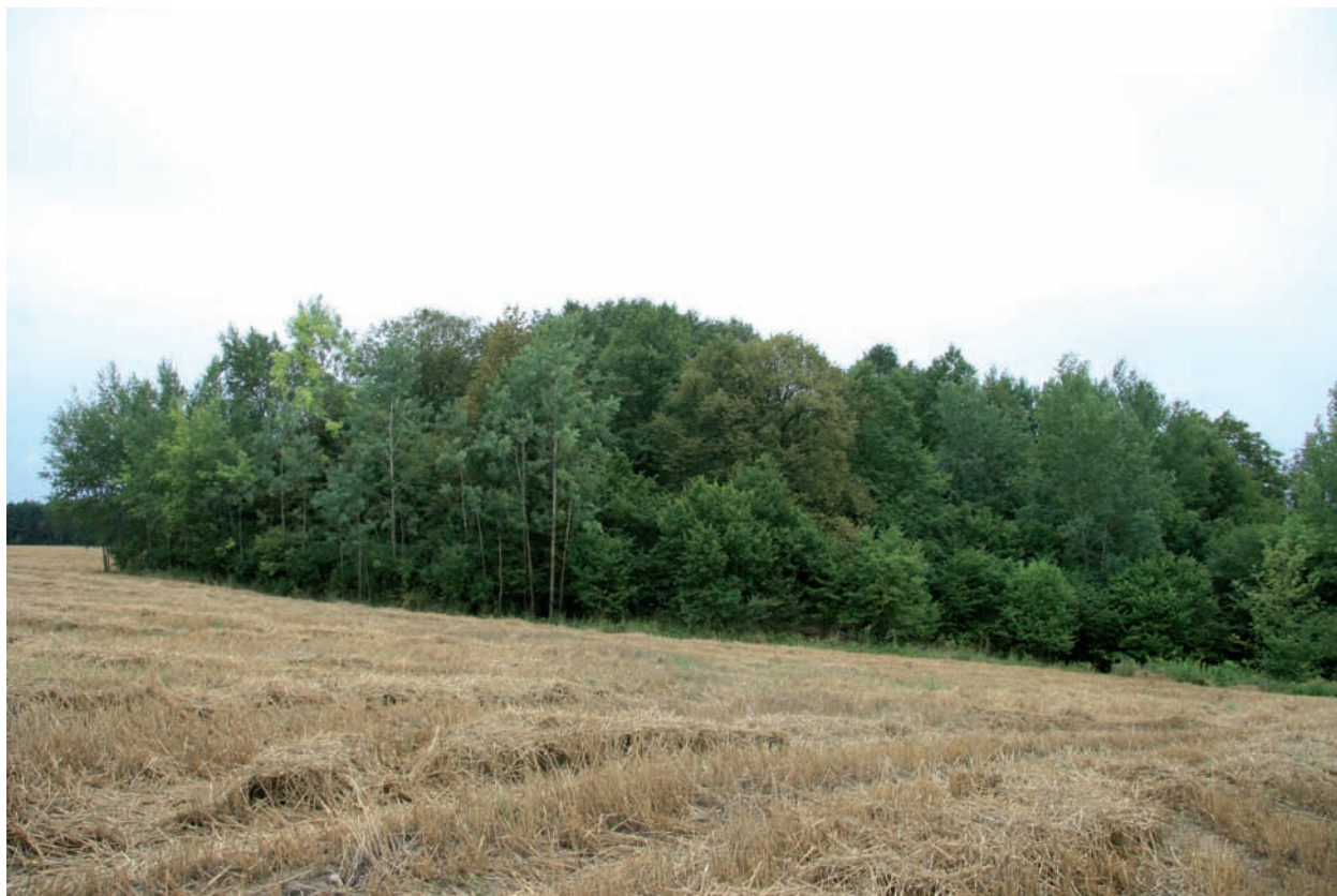
Ryc. 5. Borownia. Lipiec 2017 r. Widok z północy na segment A prehistorycznej kopalni krzemienia (por. ryc. 4). W dolnej części widoczne jest przejście w zieleni na wykop I – krzyżowy. Fot. J. Lech Fig. 5. Borownia. July 2017. View from the north to segment A of the prehistoric flint mine (see Fig. 4). In the lower part one can see the transition in green to the trench I – cross-shaped one. Photo by J. Lech

Otrzymanie pozwolenia konserwatorskiego na badania wykopaliskowe wymagało załączenia zgody właściciela terenu. Gdy okazało się, że w przypadku Borowni nie są nim Lasy Państwowe, nie było prosto go ustalić. Zadania podjął się mgr W. Szczaluba, dyrektor muzeum ostrowieckiego. Po poszukiwaniach archiwalnych i instytucjonalnych ustalono, że obszar kopalni należy częściowo do właścicieli prywatnych, a częściowo do skarbu państwa, przy czym ta druga część jest w administracji różnych instytucji. W zgłoszeniu na Listę światowego dziedzictwa obszar kopalni potraktowano szeroko, określając go na 11,6 ha, z czego 54,34% stanowi własność publiczną, a pozostałe 45,66% – pięć działek, własność prywatną indywidualnych właścicieli ( Krzemionki 2018, 245-246).