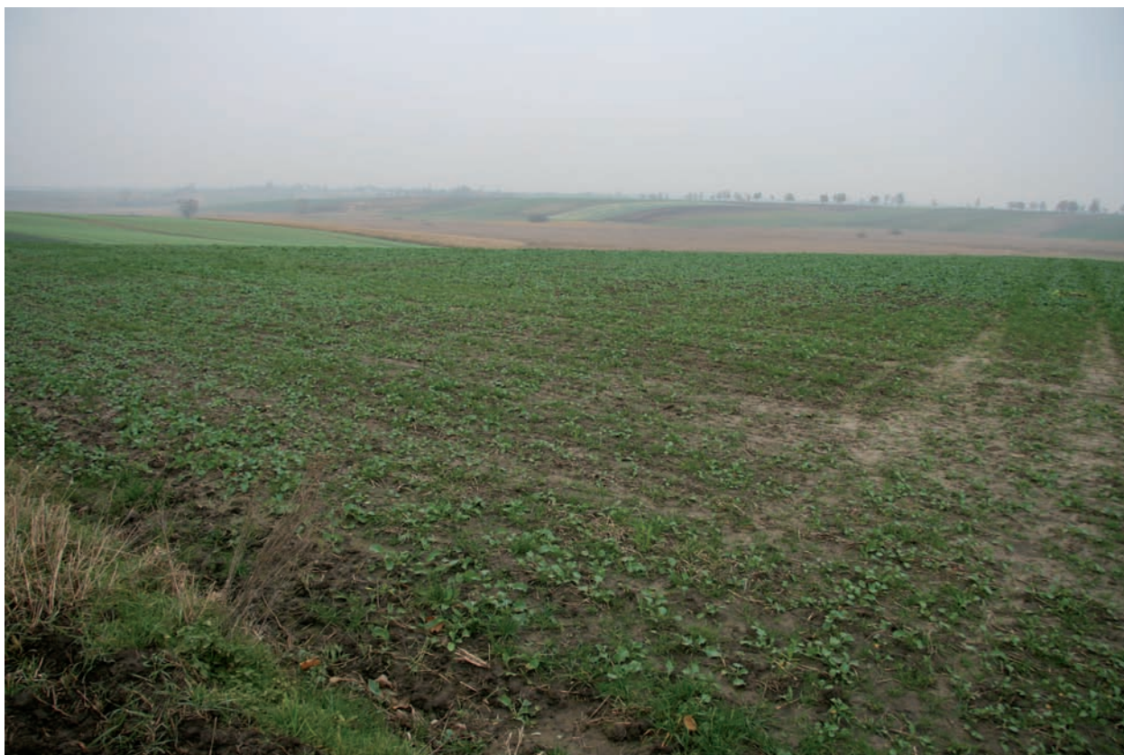
Ryc. 17. Mierzanowice, pow. opatowski. Wyżyna Sandomierska. Widok na część stanowiska I oraz dolinę rzeczki Gierczanka w grudniu 2017 r.

Materiały archeologiczne należące do kultury pucharów lejkowatych występują w otoczeniu kopalni Borownia. Typowy zespół materiałów podomowych tej kultury został opublikowany z „osiedliska przy zrobach” położonego obok kopalni (Zalewski, Borkowski 1996, 39-46). Skłaniają one do