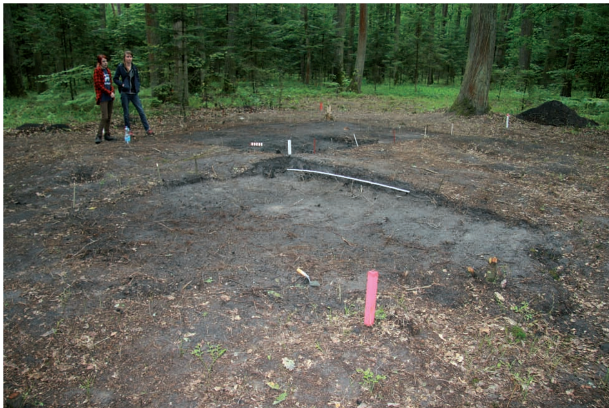
Ryc. 2. Krzemionki, pow. ostrowiecki. Przedgórze Ilżeckie. Las Baczyńskiego. Lipiec 2015 r. Badania wykopaliskowe mielerza nr 192. Skale 2 m oraz 20 cm. Szpachelka wskazuje północ. Fig. 2. Krzemionki, Ostrowiec Świętokrzyski district. Ilża Foreland. Baczyński Forest. July 2015. Excavations on charcoal pile No. 192. Scales 2 m and 20 cm. Trowel points north.

stulecia, a okresowo prawdopodobnie i wcześniej. Eksploatowano występujące wzdłuż Kamiennej rudy żelaza, produkowano w mielerzach węgiel drzewny służący do wytopu i przetwarzania tego surowca. Można mieć pewność, że w tym czasie wycinano też drzewa z terenu prehistorycznego pola górniczego w Borowni, a w jego pobliżu wypalano węgiel. Widoczne na powierzchni ślady po mielerzach znamy z Lasu Baczyńskiego na terenie Rezerwatu Krzemionki Opatowskie. Na miejscu mielerza nr 192 (ryc. 2) przeprowadzono w lipcu 2015 r. badania wykopaliskowe 3 (Lencewicz 1955,