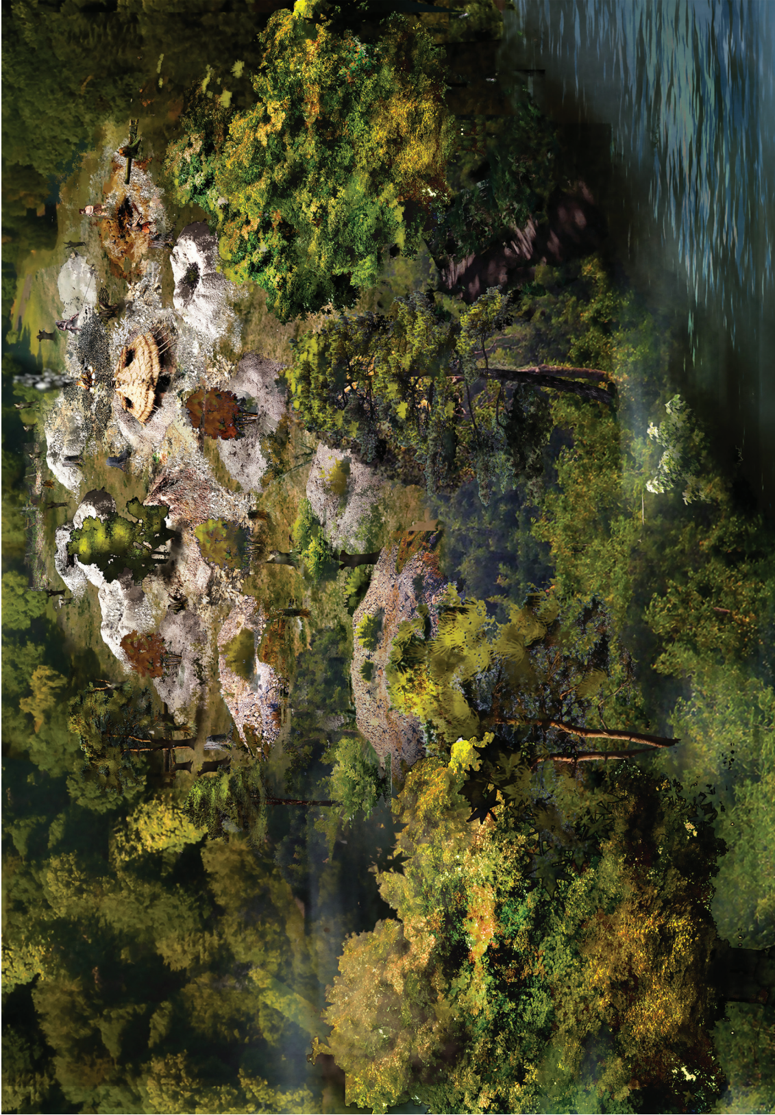
Ryc. 21. Borownia. Wizualizacja segmentu A kopalni krzemienia we wczesnej epoce brązu. Przygotował Tymoteusz Piotrowski według koncepcji J. Lecha Fig. 21. Borownia. Visualization of segment A of the flint mine in the early Bronze Age. Prepared by Tymoteusz Piotrowski according to the concept of J. Lech