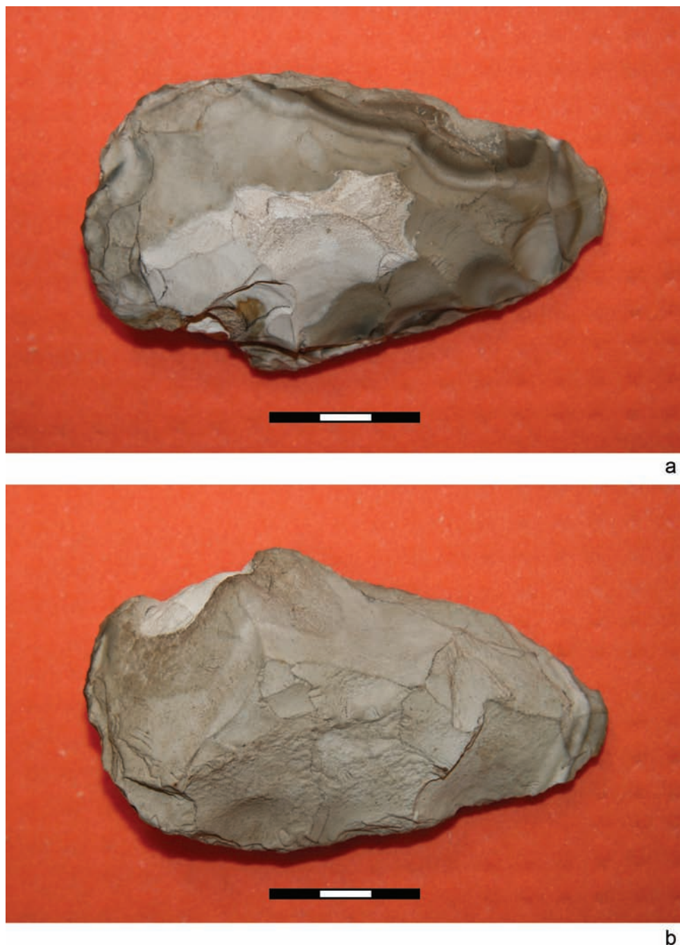
Ryc. 13. Borownia. Kopalnia krzemienia. Segment D. Wykop II. Zaawansowana forma przygotowywanego ostrza siekiery krzemiennej. Okaz spatynowany; a – strona górna; b – widok z drugiej strony.