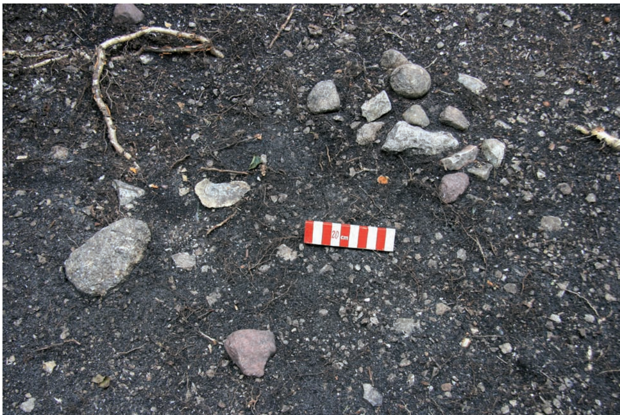
Ryc. 10. Borownia. Segment A. Wykop krzyżowy I/2017. Część zachodnia. Metr 6 w dniu 8 lipca 2017 r. Środek skupienia tłuczków kamiennych. Skala 20 cm.