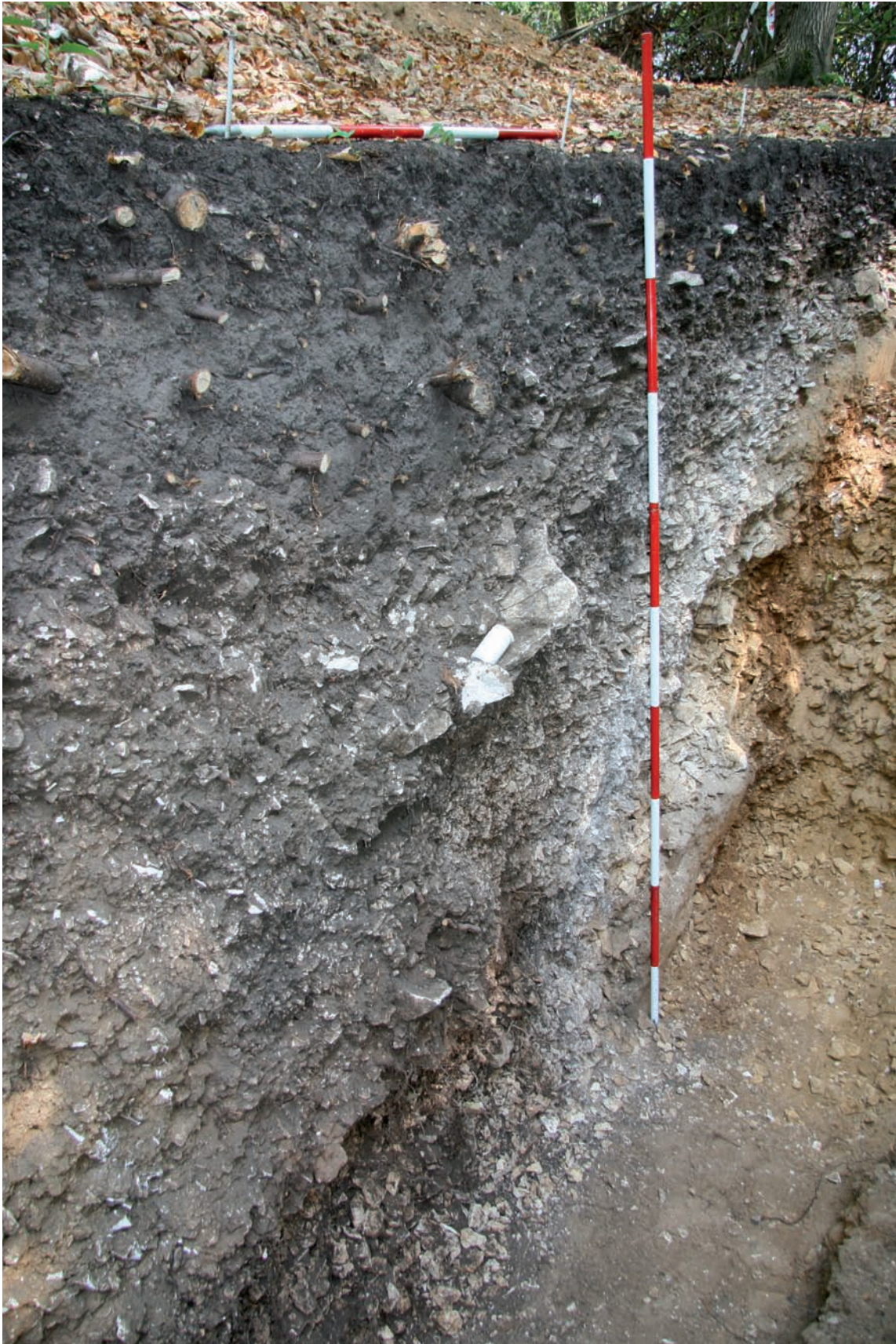
Ryc. 9. Borownia. Segment A. Wykop krzyżowy I/2017. Część wschodnia. Profil N. Fragment wypełnienia szybu A1. Widok w kierunku E, część metra 7 oraz metry 6-4. Podziałka na tyczkach mierniczych 25 cm. Fig. 9. Borownia. Segment A. Cross-shaped trench I/2017. Eastern part. Section N. Fragment of shaft A1 fill. View facing E, part of metre 7 and metres 6-4. Scale on ranging rods 25 cm.