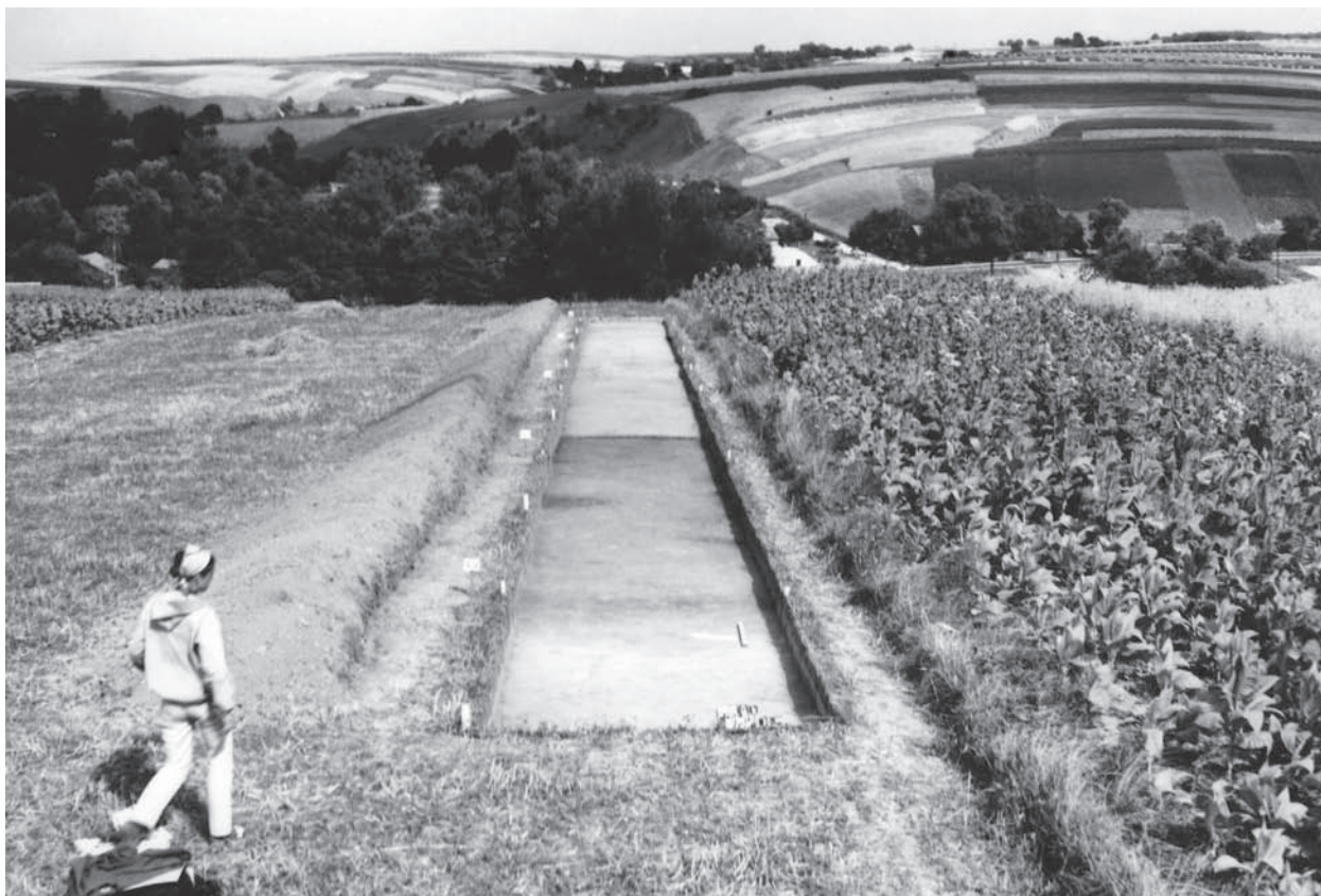
Ryc. 18. Iwanowice, pow. krakowski. Wyżyna Miechowska. Sierpień 1973 r. Widok z Babiej Góry III na dolinę rzeki Dłubnia (w dole) i Kotlinę Iwanowicką. Na pierwszym planie wykop archeologiczny b/73. Fig. 18. Iwanowice, Kraków district. Miechów Upland. August 1973. View from Babia Góra III towards the valley of the Dłubnia river (below) and the Iwanowice Valley. In the foreground archaeological trench b/73.

od rzeki w głębi wysoczyzny rósł bór sosnowo-dębowy ( Pino-Quercion ). Pozostałości osady (osad?) mierzanowickiej na stanowiskach archeologicznych Babia Góra I – III zajmują dzisiaj znaczną powierzchnię około 4,5 ha, ale trzeba pamiętać, że trwała ona kilkaset lat (Kadrow 1991, 18). Dokładne studia materiałów archeologicznych pozwoliły wyróżnić na szerzej zbadanej Babiej Górze I i II siedem faz budowlanych poprzedzonych fazą Chłopice-Veselé. Liczba zagród, których pozostałością są dzisiaj wypełnione w pradziejach jamy, zwłaszcza o przekroju trapezowatym, wahała się w poszczególnych fazach osadnictwa od trzech do trzynastu (Machnik 1978, 50-52 i 56, ryc. 21; Kadrow 1995b, 87, ryc. 28). Jamy te uważane są za piwniczki związane z domostwami, których inne pozostałości się nie zachowały (ryc. 19). Na tej podstawie S. Kadrow szacuje liczbę mieszkańców od minimum 12 osób w szóstej fazie osadniczej do maksimum 85 mieszkańców w fazie drugiej osadnictwa (Kadrow 1991, Tabele 29-32). Była to społeczność niewiel-