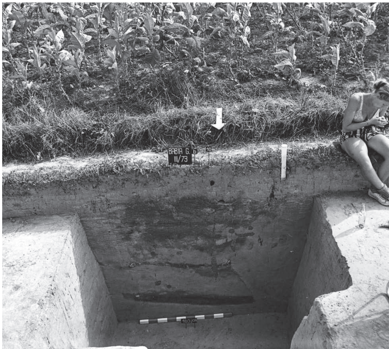
Ryc. 19. Iwanowice, pow. krakowski. Wyżyna Miechowska. Babia Góra III/73. Wykop b. Profil jamy trapezowatej z wypełniskiem warstwowym (obiekt nr 10). Głębokość wykopu 180 cm, głębokość jamy około 160 cm.

Powodów różnic można się dopatrywać w długowiecznej stabilizacji osadnictwa w rejonie Kamiennej i kształtowaniu się tu specyficznej kultury związanej od kilkuset lat z eksploatacją górnictwem cennionych surowców krzemianych. Prawdopodobne