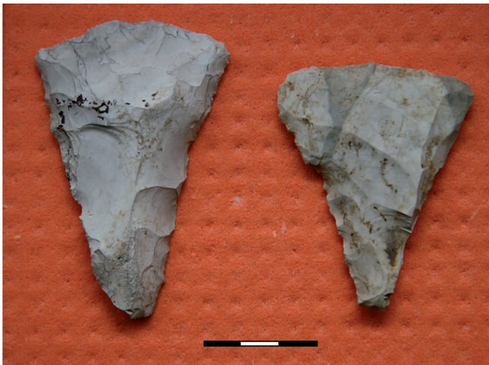
Ryc. 14. Borownia. Kopalnia krzemienia. Półwytwory ostrzy niewielkich siekier (przecinaków?) z wykopu I w segmencie A i wykopu II w segmencie D (por. ryc. 12). Okazy spatinowane. Fig. 14. Borownia. Flint Mine. Blanks of small axe blades (chisels?) from trench I in segment A and trench II in segment D (see Fig. 12). Specimens patinated.