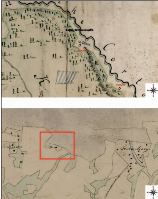
Ryc. 9. U góry — osada Wilkosy na mapie rewiru tarnogrodzkiego z 1787 r., z oznaczoną łąką Wilkosówką i osadą budziarza Fusiara; u dołu — nieopisana osada między Kmieciami i Szcząchorami, oznaczona na Planie Majdanu Księżpolskiego z 1823 r.

Fig. 9. Top — the settlement Wilkosy on the map of the Tarnogród district from 1787, with the pasture “Wilkosówka” and the dwelling of Fusiarz marked; bottom — an unnamed settlement between Kmiecie and Szcząchory, marked on the Plan of Majdan Księżpolski from 1823