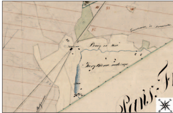
Fig. 3. Scattered huts near the village Korytków Duży, described on the map as “huts belonging to Korytków”

Ryc. 3. Rozproszone budy w okolicach wsi Korytków Duży, oznaczone na mapie jako „Budy do Korytkowa należące”