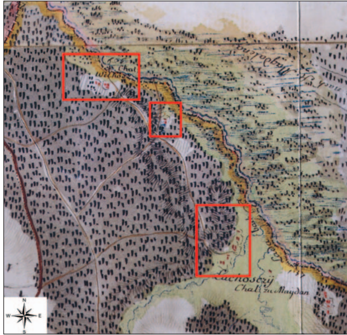
Fig. 5. Budziarze dwellings on the river Czarna Łada and in the Krasne forest on Mieg's map. The map shows the dwellings of Wilkos, Fusiarsz (not described) and the Luchowski family, and the fields (after: Janeczek A. 2015, part B, section 162, fragment)

Ryc. 6. Mapa przedstawiająca lasy, drogi, pola oraz osady leśne w okolicach wsi Tereszpol