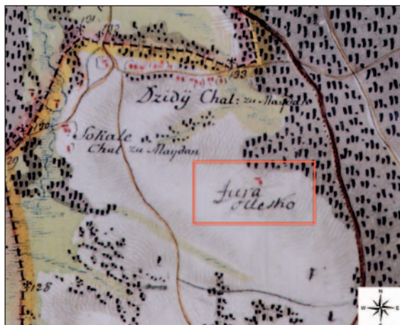
Ryc. 2. Osada Oleszka Dziury oznaczona na skraju lasu Krasne (dzisiaj pola wsi Korczowa) (za: Janeczek A. 2015, cz. B, sek. 162, fragment)