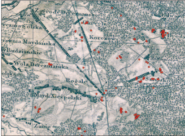
Ryc. 4. Zabudowania budziarzy (każda kropka oznacza jedną chałupę) sprzed regulacji gruntów z Planu wsi Majdan Książpolski (źródło: APL, AOZ, IMK OZ, sygn. 209), nałożone na Topograficzną Kartę Królestwa Polskiego (Karta. b.d.). Mapa kwatremistrzowska ukazuje już stan po regulacji gruntów