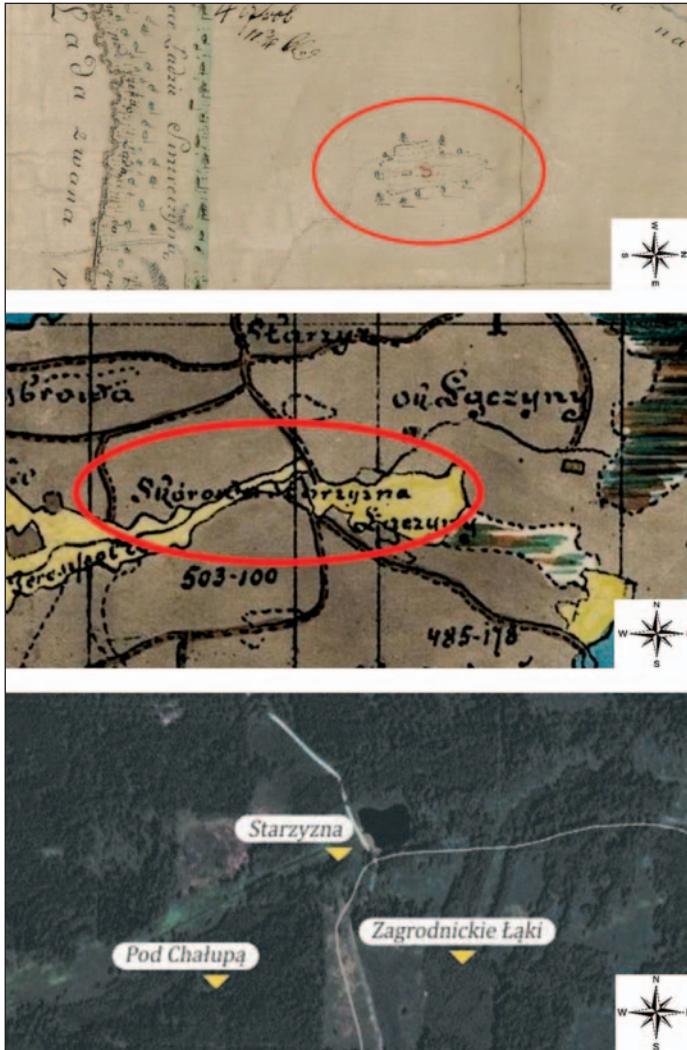
Ryc. 8. Osada Skórow: u góry — osada z otaczającymi ją polami oznaczona na mapie lasów tereszpolskich z 1787 r.; w środku — lokalizacja zanikłej osady na mapie Ordynacji Zamojskiej z przełomu XIX i XX w. opisana jako „Skurowa Starzyzna”; u dołu — fragment materiałów z wystawy edukacyjnej „Dzieje Brodziaków i Edwardów” z oznaczeniem nazw terenowych „Starzyzna” oraz „Pod Chalupką”, odnoszących się do okolicy zaginionej osady budziarzy Skórow

Fig. 8. The settlement of the Skóra family: top — the settlement with surrounding fields on the map of Teresopol from 1787; centre — the location of the extinct settlement on the map of the Zamoyski Estate from the turn of the 20th c., described as “Skurowa Starzyzna”; bottom — material from the educational exhibition “the history of Brodziaki and Edwardów”, with toponyms “Starzyzna” and “Pod Chalupką”, referring to the area of the extinct settlement of the Skóra family