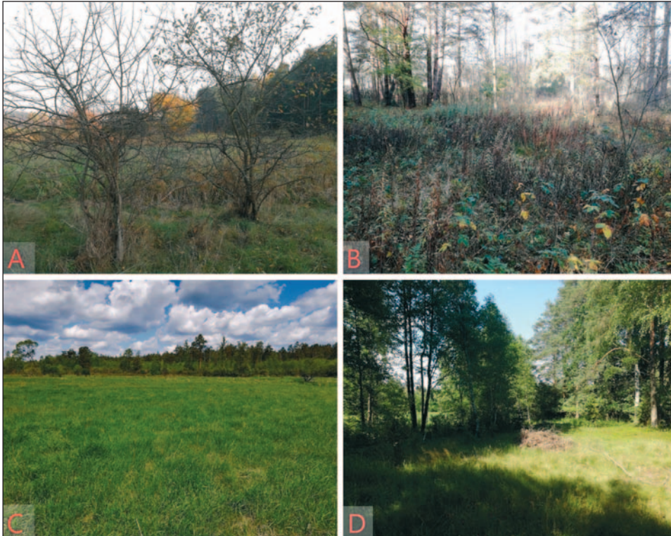
Ryc. 13. Dokumentacja fotograficzna ze wstępnych badań terenowych w okolicach zaginionych osad budziarskich w lesie Krasne oraz Ratajówka: a — drzewa owocowe w okolicy osady Wilkosy; b — zagłębienie w miejscu osady Ratajów; c — łąka nad rzeką Ładą, gdzie dawniej pola miał budziarz Fusiarcz; d — miejsce zaginionej osady Skórów zwane do dzisiaj „Starzyzna” oraz „Pod Chałupką”

Fig. 13. The photographic documentation of initial field research near the extinct settlements in the forests Krasne and Ratajówka: a — fruit trees near the settlement Wilkosy; b — a hollow in the area of the Rataj family settlement; c — the meadow on the river Łada, where Fusiarcz's fields used to be; d — the area of the extinct settlement of the Skóra family, called “Starzyzna” and “Pod Chałupką” until now