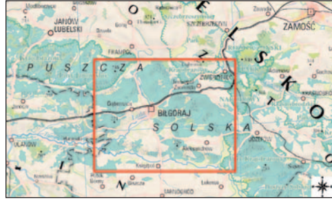
Fig. 1. The Solska Forest on a contemporary map (geoportal.gov.pl) with the research area (marked by a red rectangle) (prepared by D. Róg)

osadnictwo rolnicze w XVII i XVIII w. rozczłonkowały ten zwarty zespół leśny. W XVIII w., gdy w Ordynacji Zamojskiej zaczęły powstawać liczne osady budziarskie, z Puszczy Sandomierskiej wyodrębniły się dwie enklawy leśne: Puszcza Solska oraz leżąca na północ od niej Puszcza Janowska (Lasy Janowskie) 7 . Tereny te w znacznej części weszły w skład dóbr rodu Zamojskich już na przełomie XVI i XVII w. Rozległe lasy znajdowały się m.in. we włościach zamechskiej, krzeszowskiej, szczebrzeszyńskiej i rogozińskiej 8 . Największe skupiska osadnictwa budziarskiego zidentyfikowano na terenie Puszczy Solskiej (ryc. 1).