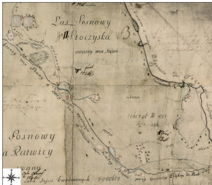
Fig. 6. A map showing forests, roads, fields and forest settlements near the village Tereszpol

opisami (ryc. 11). Oprócz najdokładniej zobrazowanych osad w lasach mapa ukazuje także budynki znajdujące się na ich skrajach. Brak na niej jednak niektórych chałup budziarzy leżących w zaroślach i wśród pól, jak choćby siedlisko budziarza Bartosza na niwie w Smół-