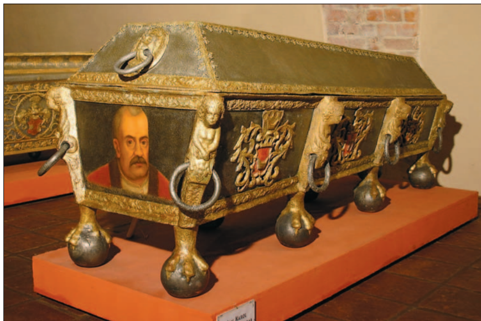
Ryc. 1. Trumna cynowa i portret trumienny Jana Karola Opalińskiego, z ok. 1695 r., w Muzeum „Zamek Opalińskich” w Sierakowie, źródło: https://pl.wikipedia.org/wiki/Jan_Karol_Opaliński#/media/Plik:JanKarolOpalinski_sarcophagus.jpg (dostęp 25.06.2020)

Studia nad portretem trumiennym sporadycznie odnosiły się również do tych konterfektów, które były mocowane do trumien metalowych (tj. cynowych, miedzianych, ołowianych), nazywanych w literaturze sarkofagami. Te także nie odpowiadały przyjętej definicji, gdyż bywały malowane bezpośrednio na czole skrzyni, a ich pole miało kształt czworoboczny, tak jak w przypadku portretu trumiennego Jana Karola Opalińskiego (zm. w 1695 r.) 12 (ryc. 1).