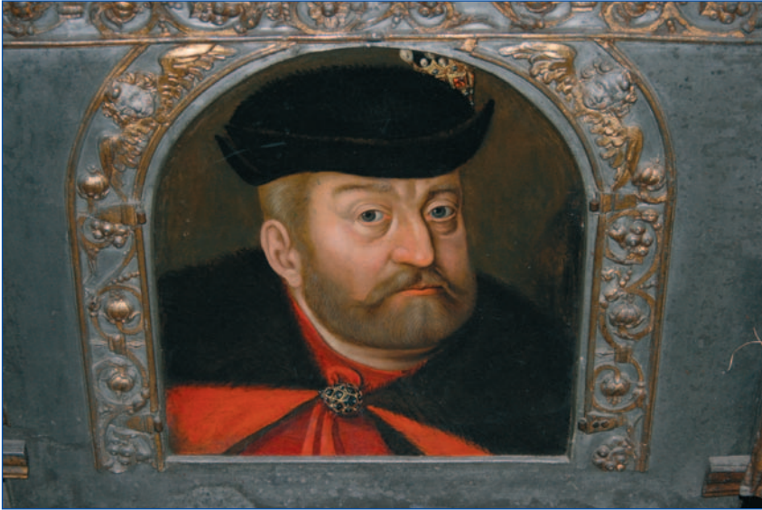
Ryc. 3. Portret trumienny Adama Sędziwoja Czarnkowskiego, przed rokiem 1627, na -przedniej ścianie trumny cynowej, źródło: https://sarmatyzm.files.wordpress.com/2013/11/img_97021.jpg (dostęp 25.06.2020)