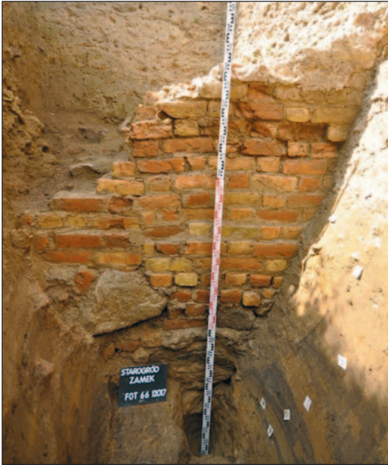
Ryc. 7. Starogród. Fundament muru parchamu odsłonięty podczas badań archeologicznych w obrębie wykopu nr 1 (wg Wasik B. 2017c, s. 39, rys. 17)