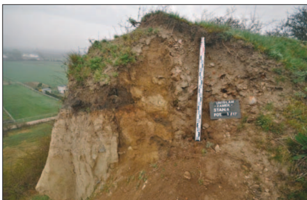
Fig. 6. Unisław. A precipice with the cut of the western wall of the upper castle (after Wasik B. 2017b, p. 36, fig. 10)

w Papowie Biskupim, którego mury niemal w całości wykonano z kamieni narzutowych 40 . Niezależnie jednak od rodzaju konstrukcji prace rozbiórkowe ze względów technicznych i dla zachowania bezpieczeństwa musiały przebiegać w takiej samej kolejności — od najwyższych partii budowli do poziomu jej posadowienia 41 .