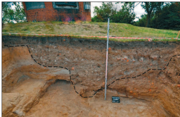
Ryc. 5. Kowalewo Pomorskie. Negatyw rozbiórkowy kurtyny zamku wysokiego zarejestrowany podczas badań archeologicznych, w obrębie wykopu nr 4 (wg Wiewióra M., Wasik B. 2017, s. 141, rys. 6)

Fig. 5. Kowalewo Pomorskie. The demolition cut of the curtain wall of the upper castle found during the excavations in trench 4 (after Wiewióra M., Wasik B. 2017, p. 141, fig. 6)