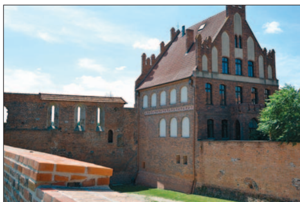
Ryc. 4. Toruń. Dwór Bractwa św. Jerzego (Dwór Mieszczański), widok od strony północno-wschodniej