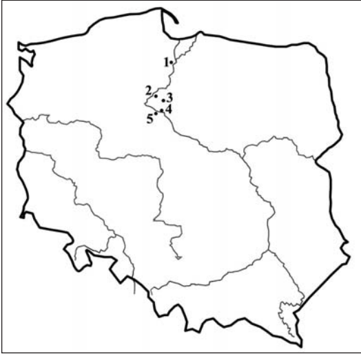
Ryc. 2. Lokalizacja wzmiankowanych w artykule krzyżackich obiektów warownych: