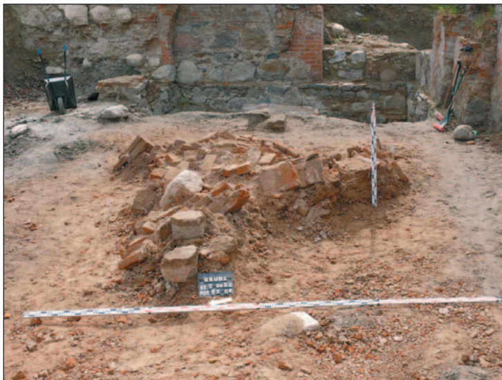
Ryc. 8. Grudziądz. Skupisko niewykorzystanych cegieł rozbiórkowych zalegające w miejscu dawnego skrzydła południowego zamku wysokiego, odsłonięte podczas badań archeologicznych