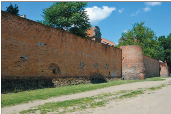
Fig. 3. Toruń. A retaining wall from the second half of the 15th c. at Podmurna Street, viewed from the south-east