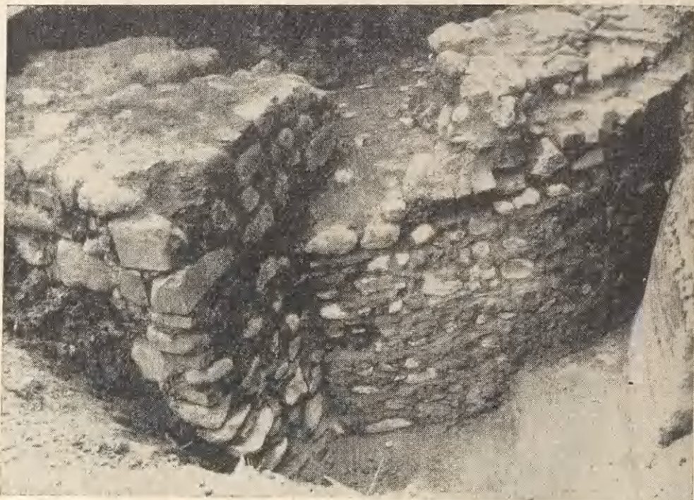
Ryc. 2. Gniezno, stan. 15. Ar 26. Zewnętrzna ściana muru absydy kaplicy Św. Stanisława