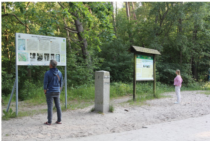
Fot. 3. Kamień wersalski w Dębках wraz z edukacyjną tablicą informacyjną The "Versailles Stone" at Dębki with an educational information board

kończą się trasy spływów kajakowych. Pewnego rodzaju uzupełnieniem „tematyki granicznej” są również ruiny dawnej polskiej strażnicy granicznej. W miejscowości jest bardzo dobrze rozwinięta przestrzeń turystyczna i znajdują się liczne obiekty noclegowe i turystyczne (głównie o charakterze sezonowym).