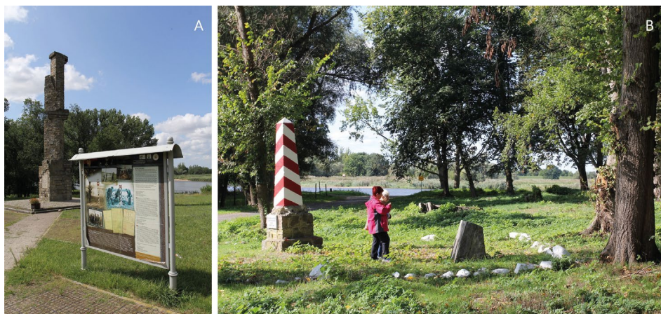
Fot. 4. Pomniki słupów granicznych w Czelinie

A) obelisk upamiętniający wkopanie pierwszego słupa oraz tablica informacyjną B) pomnik pierwszego słupa granicznego wraz z edukacyjną tablicą informacyjną Border post monuments at Czelin