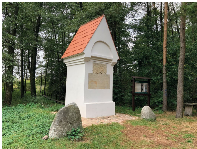
Fot. 1. Słup graniczny w Boguszach

Najbardziej znanym obiektem oznaczenia najdawniejszych granic na obszarze Polski jest słup graniczny w formie kapliczki na dawnym trójstyku Prus Książęcych, Korony Królestwa Polskiego i Wielkiego Księstwa Litewskiego (fot. 1). W 1569 r. w wyniku Unii Lubelskiej