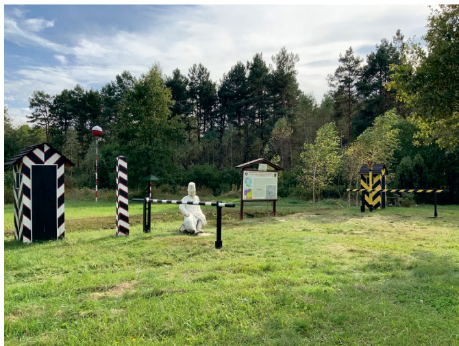
Fot. 2. Rekonstrukcja przejścia granicznego wraz ze słupami granicznymi: rosyjskim (na pierwszym planie) oraz austro-węgierskim (na dalszym planie) A reconstructed border crossing with Russian (foreground) and Austro-Hungarian (background) border posts

siedzącego żołnierza – pilnującego granicy. Słupy graniczne i szlabany odległe są od siebie o 17 m, czyli tak jak w oryginale, aby w pasie granicznym zmieściła się furmanka z zaprzęgiem (Mielniczuk, 2012). Na placu są także przygotowane drobne elementy infrastruktury turystycznej, jak ławki, kosze na śmieci i tablice z mapami 2 . Część z tablic informacyjnych zawiera krótkie teksty, takie jak: „Pokoleniom ku przestrodze” lub „Rekonstrukcja przejścia granicznego z okresu Zaborów Austro-Węgier i carskiej Rosji Lipa – Dąbrowa Rzeczycka”: