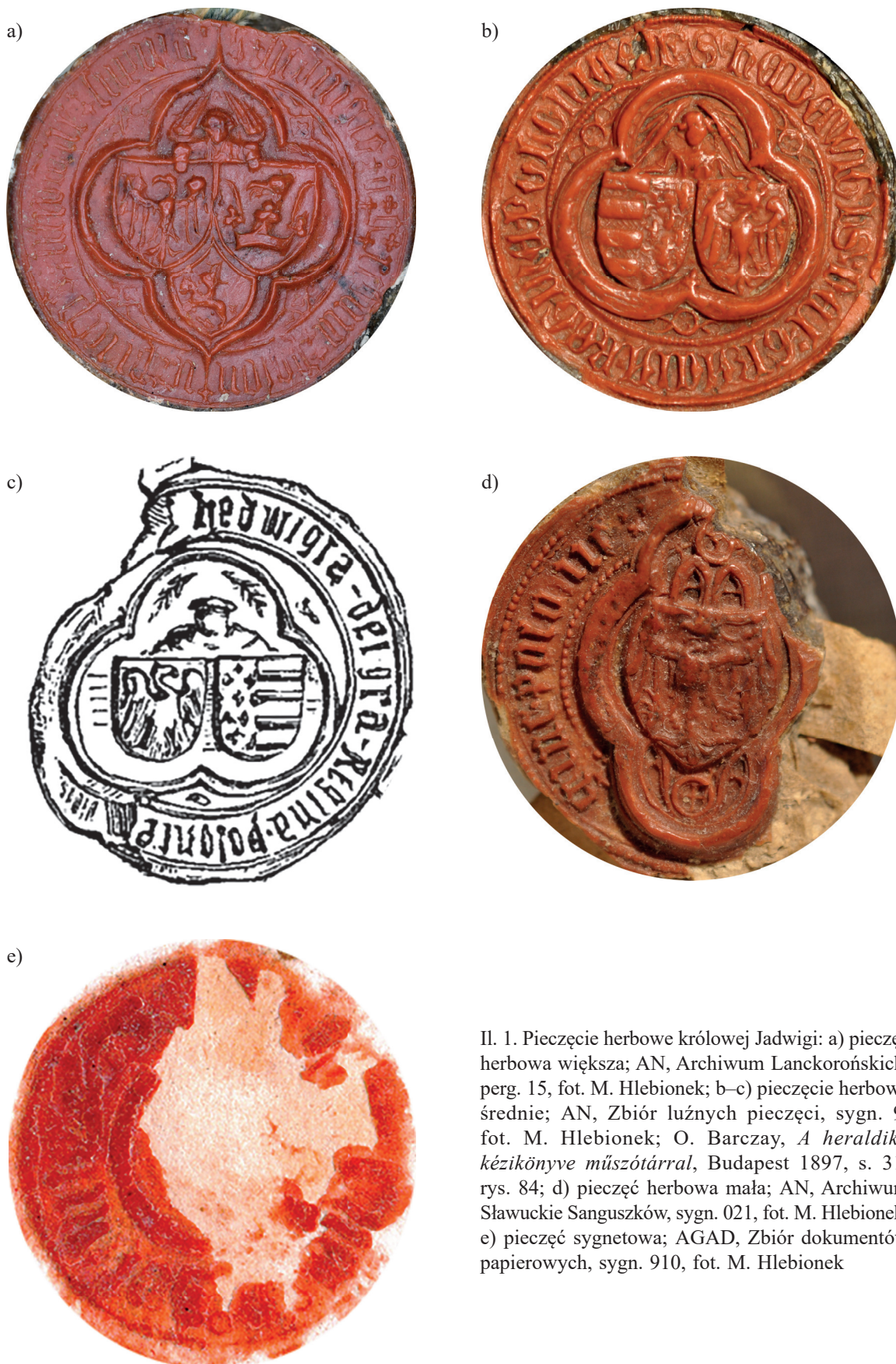
Il. 1. Pieczęcie herbowe królowej Jadwigi: a) pieczęć herbowa większa; AN, Archiwum Lanckorońskich, perg. 15, fot. M. Hlebionek; b–c) pieczęcie herbowe średnie; AN, Zbiór luźnych pieczęci, sygn. 9, fot. M. Hlebionek; O. Barczay, A heraldika kézikönyve műszótárral , Budapest 1897, s. 31, rys. 84; d) pieczęć herbowa mała; AN, Archiwum Sławuckie Sanguszków, sygn. 021, fot. M. Hlebionek; e) pieczęć sygnetowa; AGAD, Zbiór dokumentów papierowych, sygn. 910, fot. M. Hlebionek