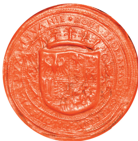
Il. 4. Pieczęć królowej Bony Sforzy; AN, Zbiór luźnych pieczęci, sygn. 32