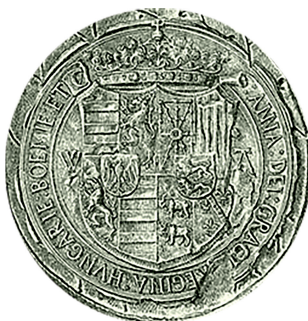
Il. 6. Pieczęć Anny de Foix, żony Władysława II Jagiellończyka; odrys za: V. Fraknói, Werbőczy István 1458–1541 , Budapest 1899, s. 109, fig. 41