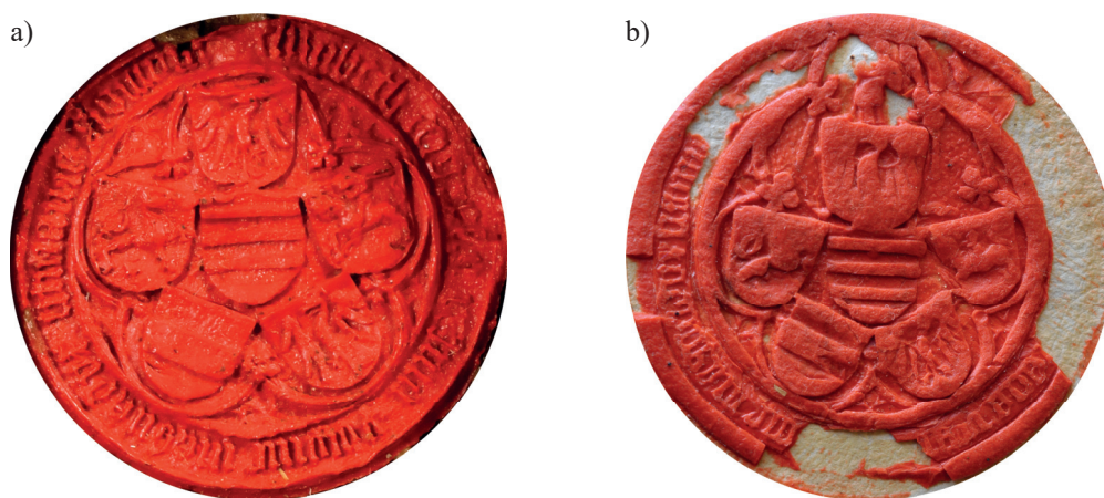
Il. 3. Pieczęcie królowej Elżbiety Rakuszanki: a) znana z lat 1454–1457; Praga, Národní archiv, Archiv České koruny (1158–1935), sygn. 1588; b) znana z lat 1471–1492; AP Gdańsk, Akta miasta Gdańska, 300, D/3, 450, fot. M. Hlebionek