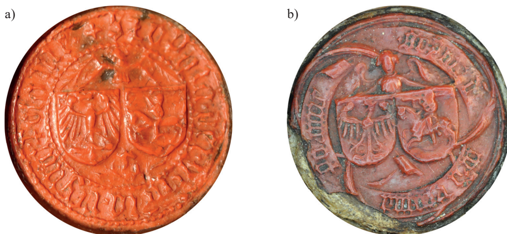
Il. 2. Pieczęcie Zofii Holszańskiej: a) królowej; AN, Zbiór luźnych pieczęci, sygn. 16, fot. M. Hlebionek; b) królowej wdowy; AGAD, Zbiór dokumentów pergaminowych, sygn. 5042, fot. M. Hlebionek