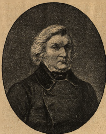
ПОРТРЕТЪ МИЦКЕВИЧА находящійся въ Румянцевскомъ музее въ Москвѣ

Перечисляя русскіе портреты Мицкевича, слѣдуетъ непременно упомянуть о всѣхъ тѣхъ изображеніяхъ поэта, которые хотя и не появились въ русскихъ изданіяхъ, но сдѣланы и напечатаны въ Россіи. Къ числу такихъ принадлежитъ прежде всего нѣсколько литографированныхъ портретовъ Мицкевича, напечатанныхъ во время пребыванія здѣсь поэта и не упомянутыхъ почему-то въ статьѣ г. Мейера. Первый изъ нихъ—копія съ портрета Мицкевича масляными красками на скалѣ, работы Ваньковича, изданная въ Петербургѣ въ 1829 г., въ литографіи Гелльбаха, и рисованная на камнѣ самимъ художникомъ; о ней упоминаетъ Адамъ Плугъ въ журналѣ «Kłosy» (т. XXXVIII № 984), добавляя, что нѣкоторые экземпляры этой литографіи Ваньковичъ самъ раскрасилъ. Существуетъ эта литографія въ нѣсколькихъ различныхъ видахъ: во-первыхъ, въ сидячей позѣ, на скалѣ, въ плащѣ накинутомъ на лѣвое плечо, съ лирою въ рукѣ. Величиною 77 \times 105 мил., затѣмъ въ буркѣ, тоже на