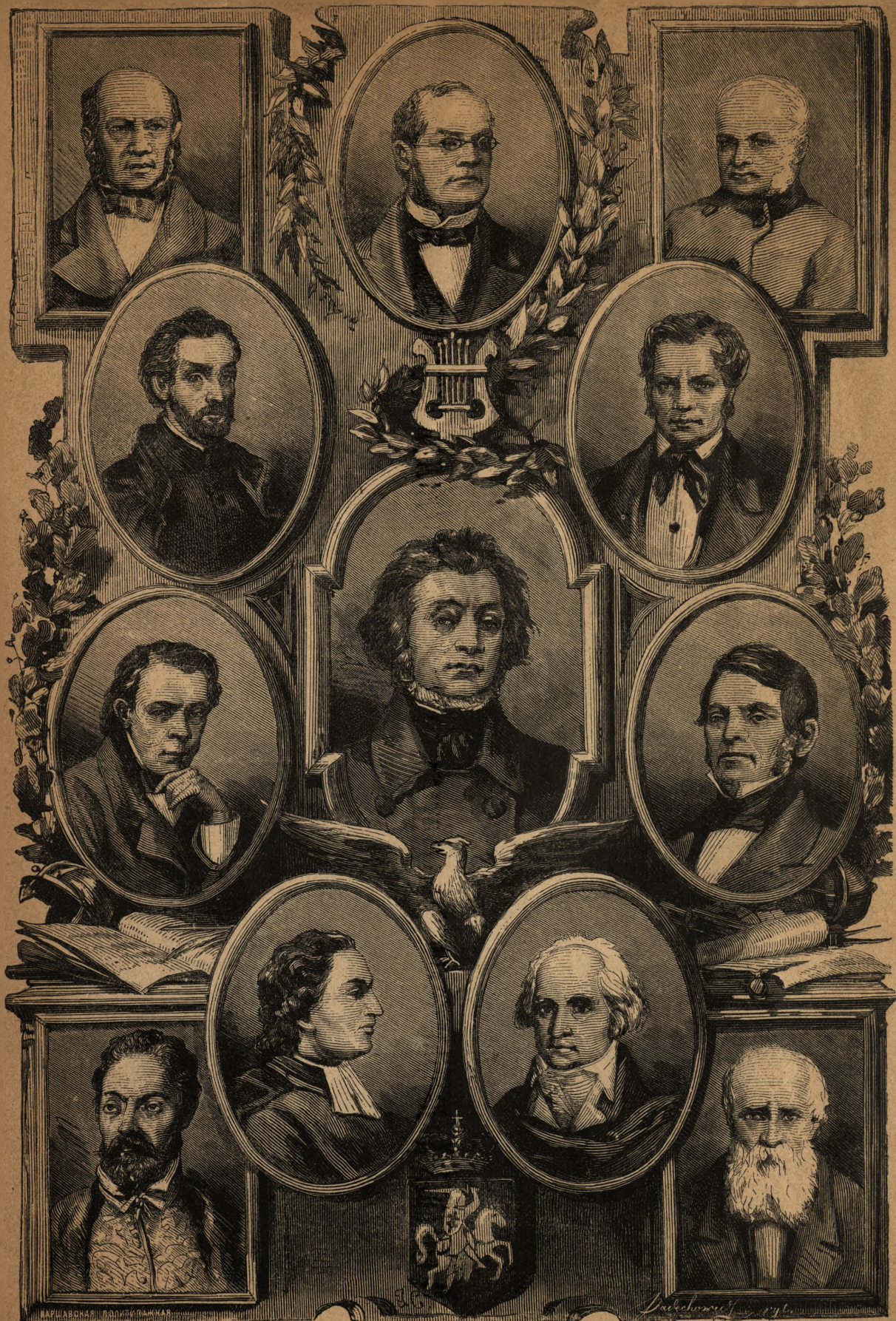
МИЦКЕВИЧЬ И ДРУГІЕ ЗНАМЕНИТЫЕ УРОЖЕНЦЫ ЛИТВЫ (РИСУНОКЪ Т. ДМОХОВСКАГО, ГРАВИРОВАННЫЙ ПАДЕХОВИЧЕМЪ, ПОМѢЩЕННЫЙ ВЪ «ЖИВОПИСНОЙ РОССИИ»)