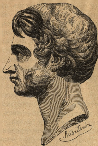
ПОРТРЕТЪ-БЮСТЬ МИЦКЕВИЧА ПОМѢЩЕННЫЙ ВЪ РУССКОМЪ ПЕРЕВОДѢ «КОМРАДА ВАЛЕНРОДА»

Первое гравированное изображеніе Мицкевича, появившееся въ Россіи, г. Мейеть относитъ къ 1858 году. Тогда-то появился портретъ Мицкевича въ «Живописной русской библіотекѣ»—Полевого (1858 г., № 10) при статьѣ Ксенофонта Полевого, одного изъ рьяныхъ русскихъ поклонниковъ поэта. Статья эта заключала въ себѣ нѣсколько цѣнныхъ свѣдѣній о пребываніи поэта въ Москвѣ и прекрасное описаніе виѣш-