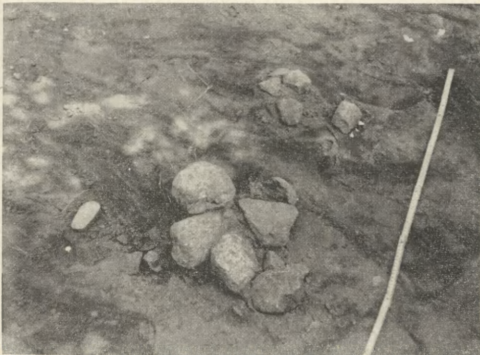
Ryc. 1. Wrocław-Osobowice. Palenisko

Ubiegłoroczne wyniki, w postaci odkrycia niewielkiej partii drewnianych konstrukcji wału, wzięto pod uwagę przy wytyczaniu nowego wykopu. W roku 1962 natrafiono na wykopy nowożytnie kulminacyjnej partii wału i w efekcie tylko na niewielkim odcinku badanego terenu zachowały się konstrukcje drewniane wału. To skłoniło nas do podjęcia prac na nowym odcinku, bezpośrednio przylegającym