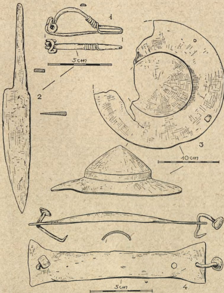
Ryc. 3. Zabieniec, pow. Częstochowa, grób 2A:

1 — żelazna zapinka; 2 — nóż; 3 — umbo; 4 — imacz