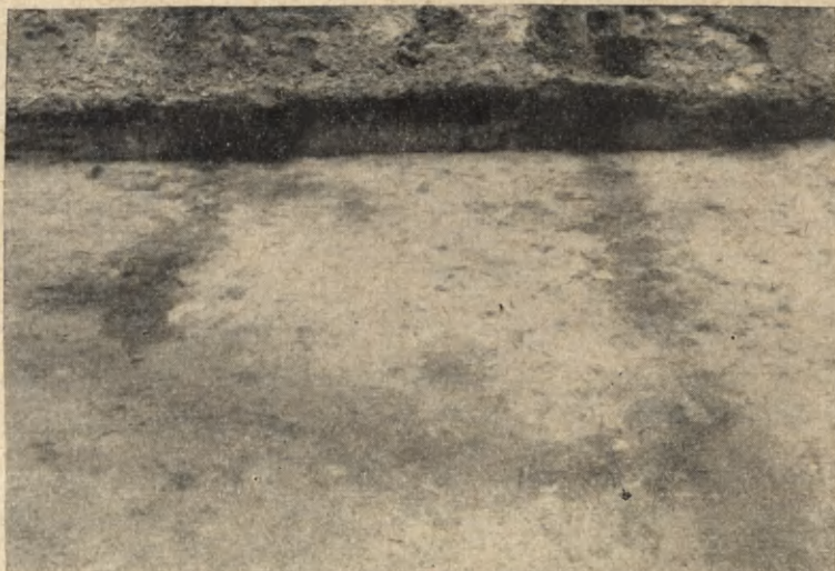
Ryc. 1. Żabieniec, pow. Częstochowa. Grób nr 5 w formie prostokątnego rowka