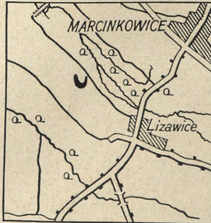
Ryc. 1. Lizawice, pow. Oława. Położenie osady

Podjęcie systematycznych badań wykopaliskowych na tym stanowisku poprzedziły szczegółowe badania powierzchniowe i sondażowe przeprowadzone wczesną wio-