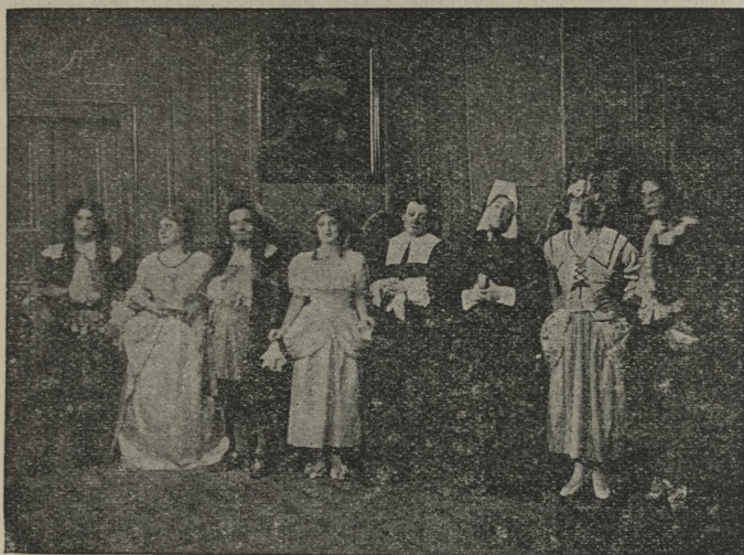
„Świątoszek“ Moliera na scenie Teatru im. J. Słowackiego w Krakowie. — Scena zbiorowa.

Wykonanie arcydzieła Molierowskiego było chlubnym popisem sceny im Słowackiego, która w pełnym