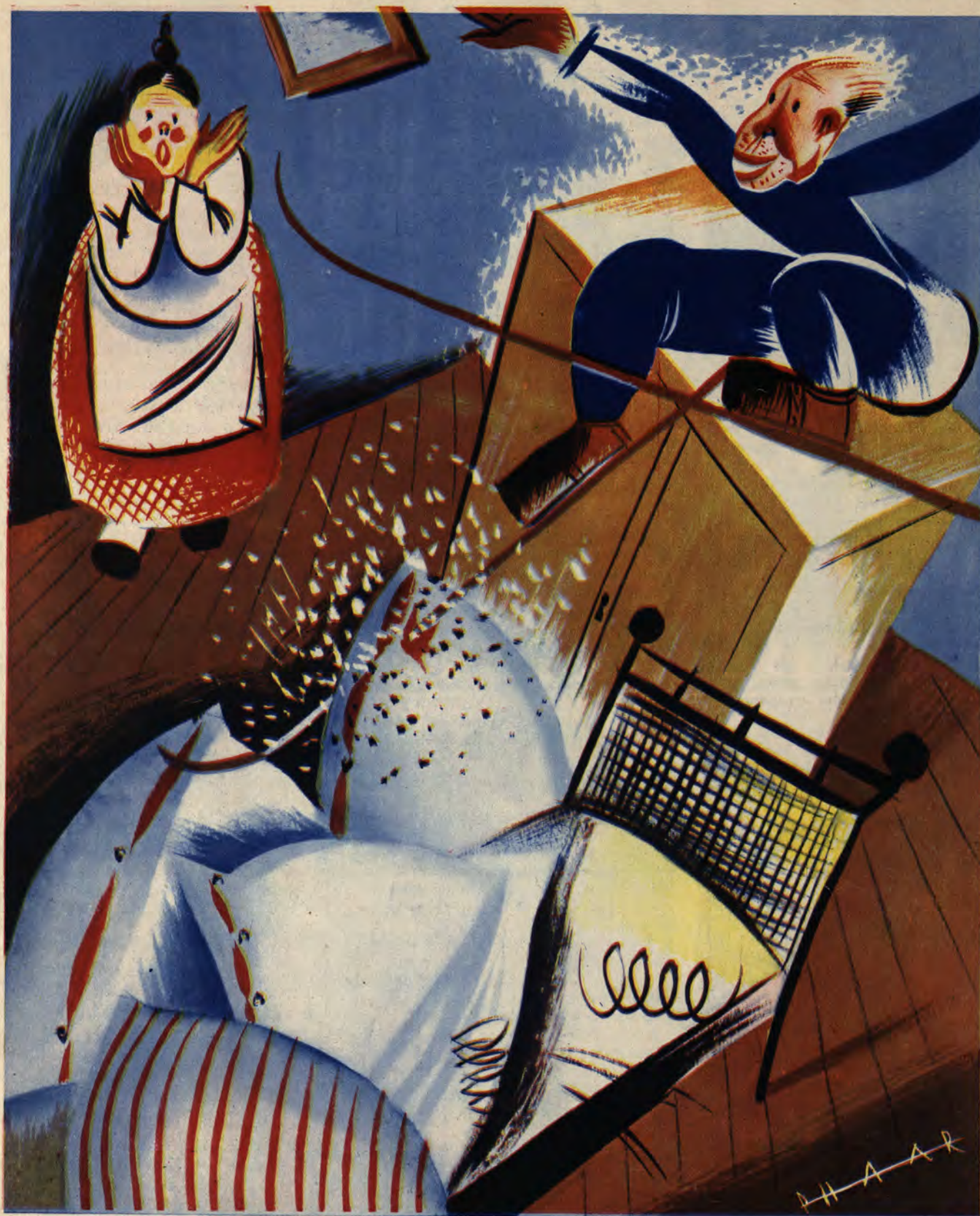
Domowa odskocznia narciarska