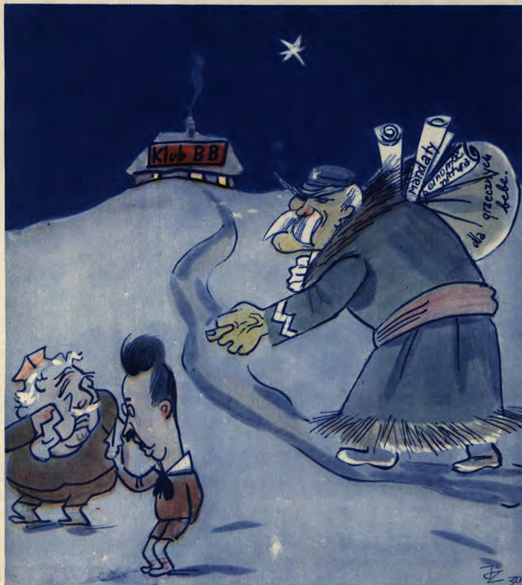
Gwiazdka dla grzecznych i niegrzecznych dzieci

Wszystko już w domu do góry nogami. Cynamon, mydło, masło. Śwąd. W pokojach rumowisko. W kuchni kramik. Jakoże tydzień do świąt.