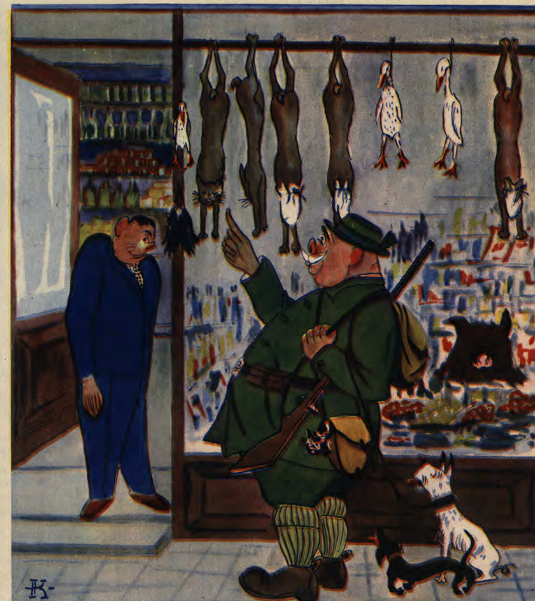
Kupiec: Na jaką zwierzyne dziś pan dobrodziej poluje, i co pan każe zarezerwować?

— Jakto, ty w zimie chcesz bandlować siatkami na motyle? — No właśnie, bo nie mam żadnej konkurencji.