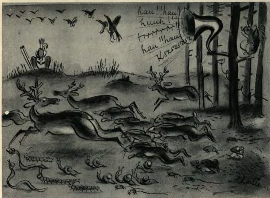
Polowanie z nagonką...