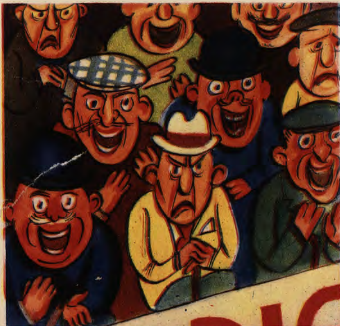
Rys. J. Zaruba

„Tu przyjmuje się do naprawy automobile i Fordy“.