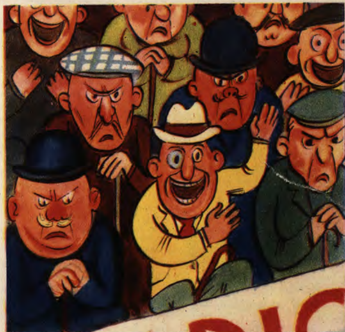
Na początku meczu...

— A bo, proszę wielmożnego pana, było już ciemno, kiedy dym pisało, to nie mogłem dojrzeć, co piszę.