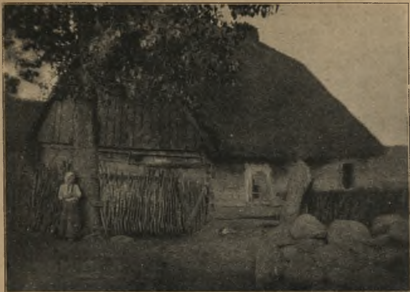
CHATA ADAMA LEJTKOWSKIEGO W MASIACH.