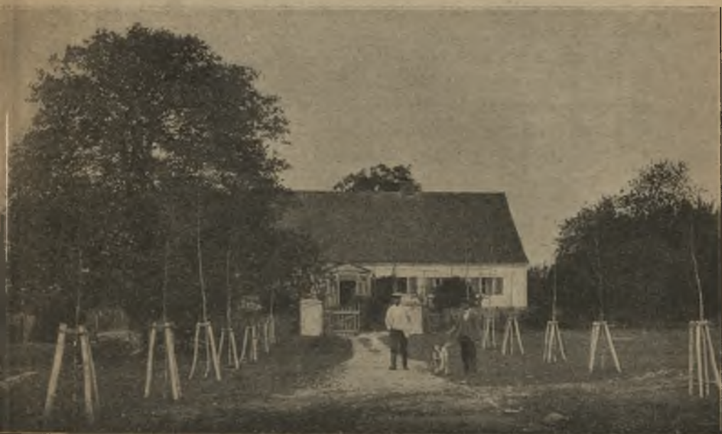
DWÓR W NOWOSIÓLKACH.

Do parafji Goniądzkiej w opisanym trójkącie należą wsie i dwory następne: Kramkówka-Mała, Rybaki, Owieczki, Żodzie, Dzieszki, Oliski, Zblutowo, Sobieski. Do parafji Trzciańskiej—następne: Mrocki, Kulesze-Kosówka, Boguszki, Mejły, Nowosiółki, Masie, Milewo, Pisanki, Zucielec, Znoski, Kołodzieże. W r. 1910 grunta dworskie Nowosiółkowskie rozparcelowane zostały włościanom wsi przyległych: Masiów, Mejtów i Dieszaków.