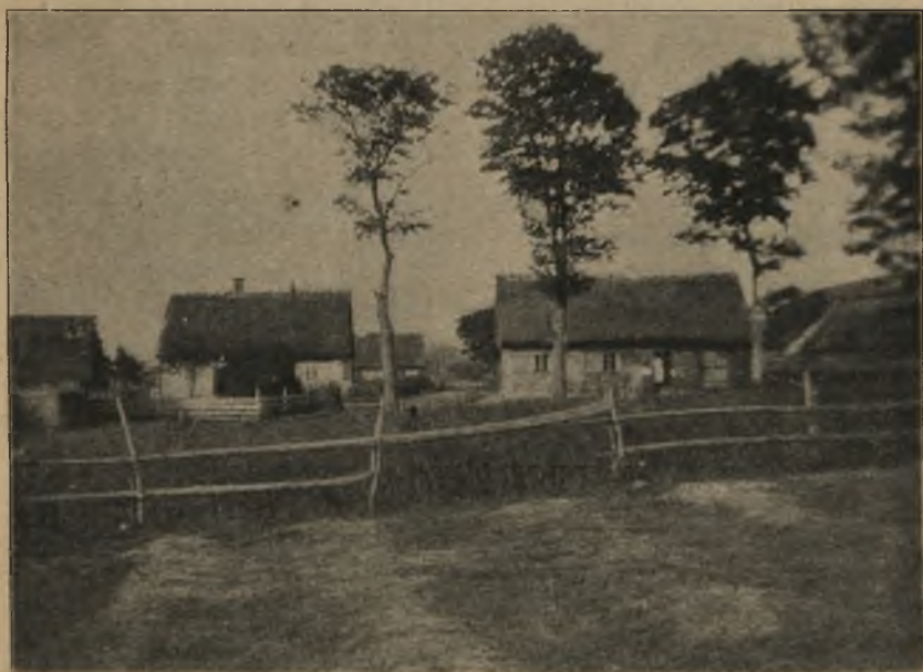
CHATY WŁOŚCIAŃSKIE W MROCZKACH.