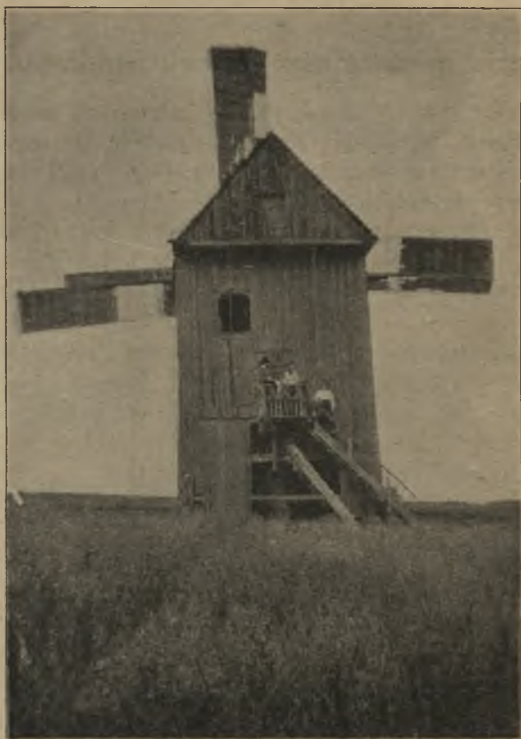
WIATRAK DWORSKI W MROCZKACH

Strawę gorącą gotują dwa razy dziennie: rano i wieczorem.