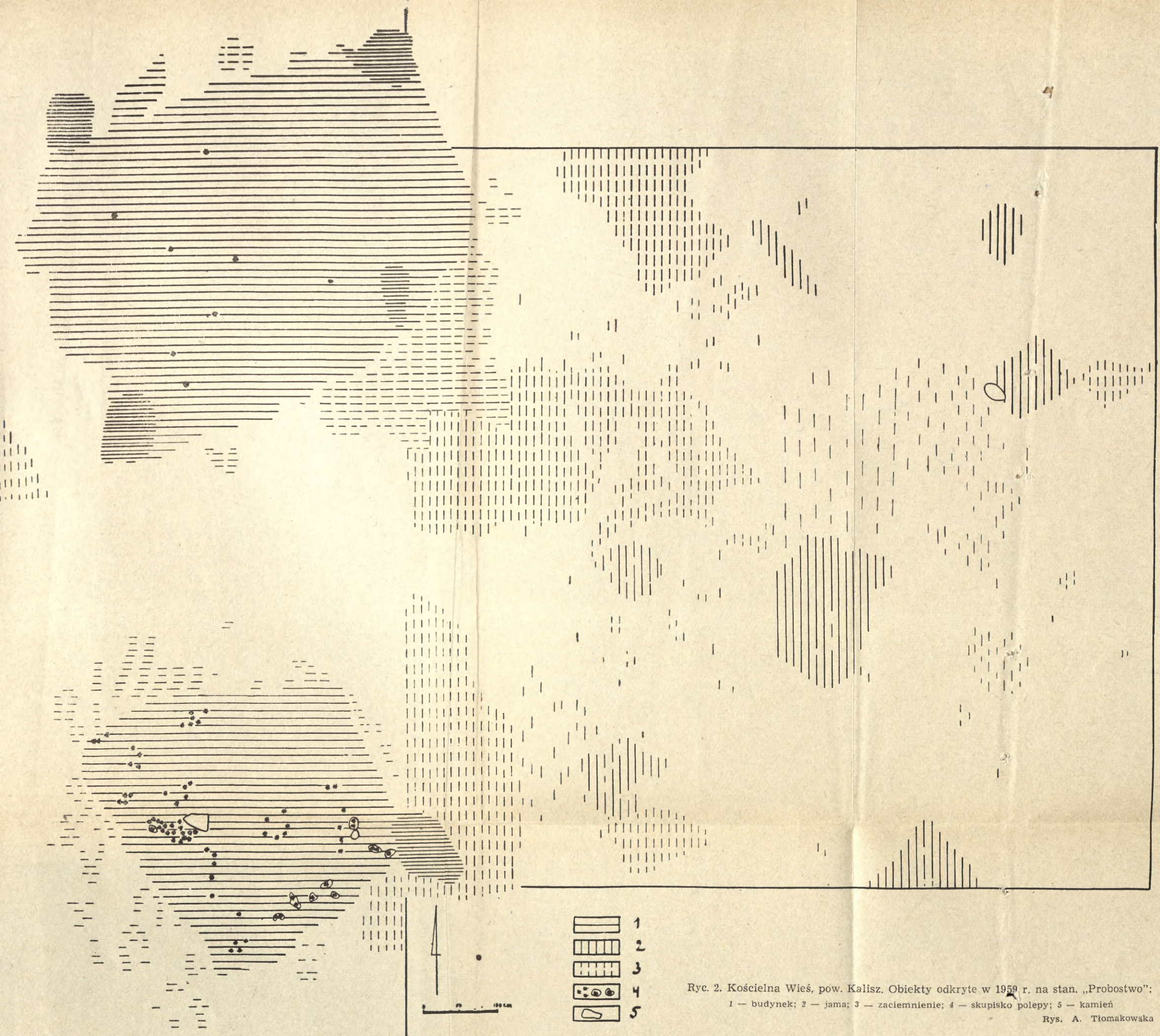
Ryc. 2. Kościelna Wieś, pow. Kalisz. Obiekty odkryte w 1959 r. na stan. „Probstwo”: 1 — budynek; 2 — jama; 3 — zaciemnienie; 4 — skupisko polepy; 5 — kamień