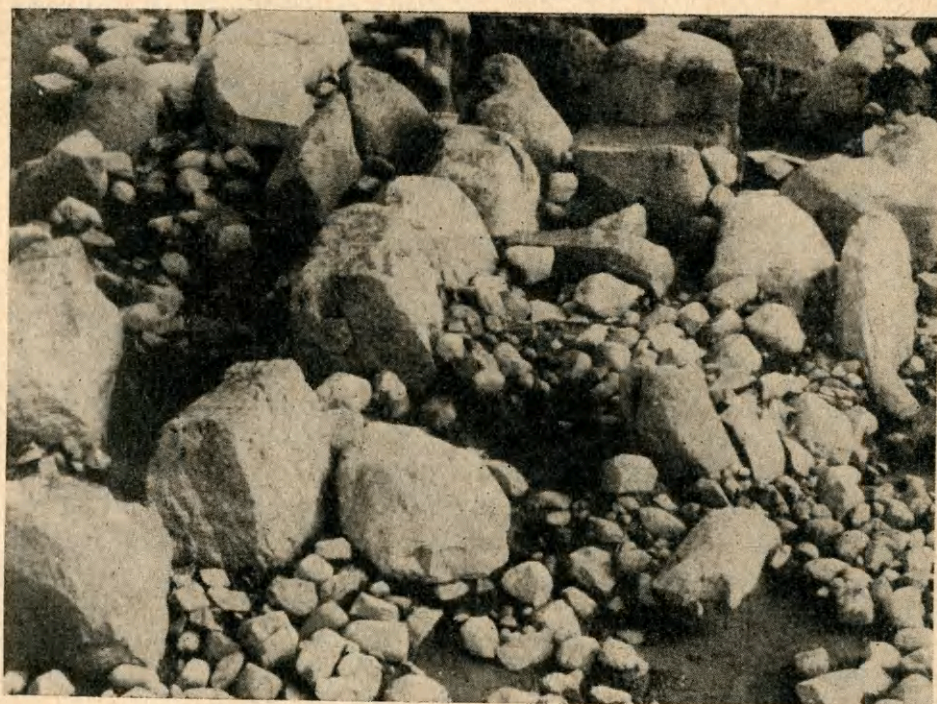
Ryc. 2. Strzelce, pow. Mogilno, kurhan nr III (stan. 3). Młodsza komora grobowca kultury amfor kulistych. Z prawej strony widać korytarz.