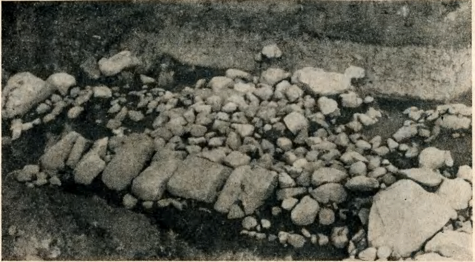
Ryc. 3. Strzelce, pow. Mogilno, kurhan nr III (stan. 3). Trzecia faza rozbudowy kurhanu (kultura iwieńska). W prawym narożniku kamienie obstawy grobowca kultury amfor kulistych.

ferowania niektórych zagadnień związanych z kulturą amfor kulistych 3 . W pierwszym rzędzie chcielibyśmy omówić stosunek do siebie obu przebadanych grobowców i rozpatrzyć, jaką grupę w obrębie społeczeństwa kultury amfor kulistych one reprezentują. Oba grobowce (nr II i III) wchodzi w skład cmentarzyska, na