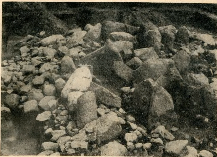
Ryc. 1. Strzelce, pow. Mogilno, kurhan nr III. Konstrukcje kamienne kurhanu kultury amfor kulistych. Widać starszą i część młodszej komory grobowej oraz krąg kamienny.