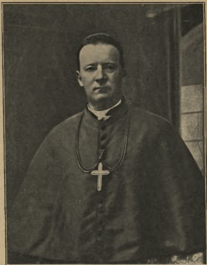
Ś. p. Ks. Arcybiskup Józef Bilczewski.

współdziałanie nazwać trzeba wręcz idealnem. Bez zarzutu najczęściej przedstawiała się jednak praca i z innymi, a przekonać o tem mogą drukowane sprawozdania Koła T. S. L. w Tarnopolu, które zanotowały ważniejsze objawy życia czyteln i szkół. Przyszłość zapowiadała się jeszcze lepiej, bo zauwa-