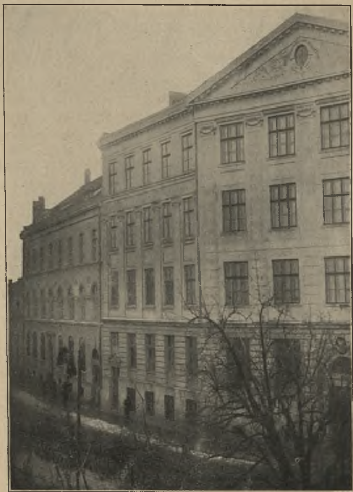
Część gmachów T. S. L. w Tarnopolu.

Towarzystwa oddaliśmy komisyjnie rządowi austriackiemu, wybuchła Wojna Światowa.