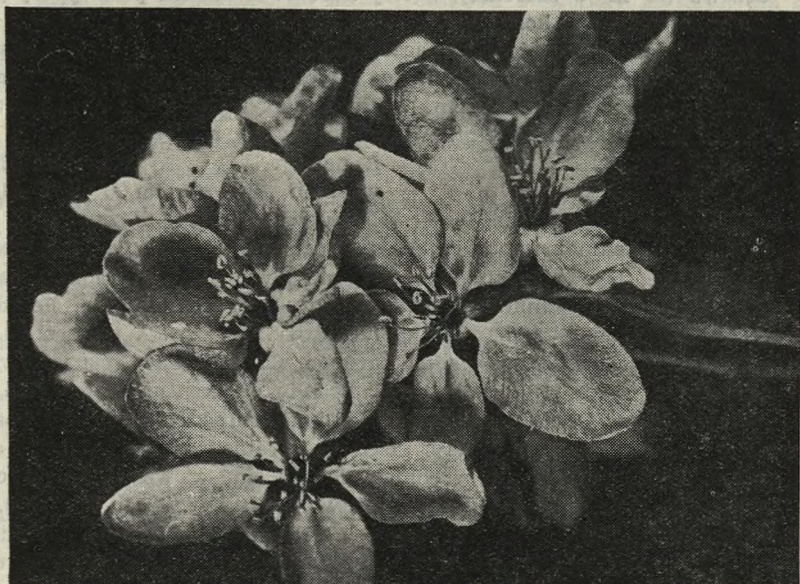
Malus purpurea „Jadwiga”

spośród wszystkich odmian jabłoni purpurowej i uważamy ją za najpiękniejszą odmianę w tej grupie.