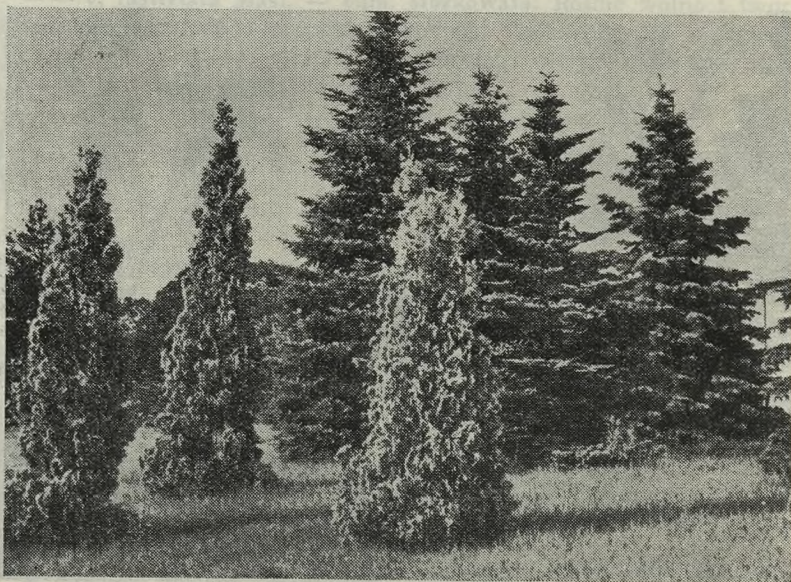
Żywotnik zachodni odm. złocista