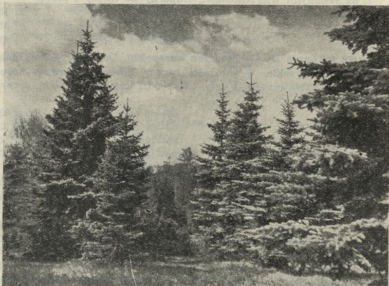
Grupa świerków srebrzystych ( Picea pungens v argentea Beiss.)

397. — pungens Engelm. — Świerk kłujący . Drzewo wysokości do 20 m. Za młodu odznacza się bardzo regularną, luźną, stożkowatą koroną. Igły bardzo sztywne, kłujące, siniozielone, lub niebieskawozielone. Am. Płn. Gatunek bardzo odporny na mrozy i suszę. Pospolicie uprawiane są jego odmiany barwne zwane powszechnie „świerkami srebrnymi”.