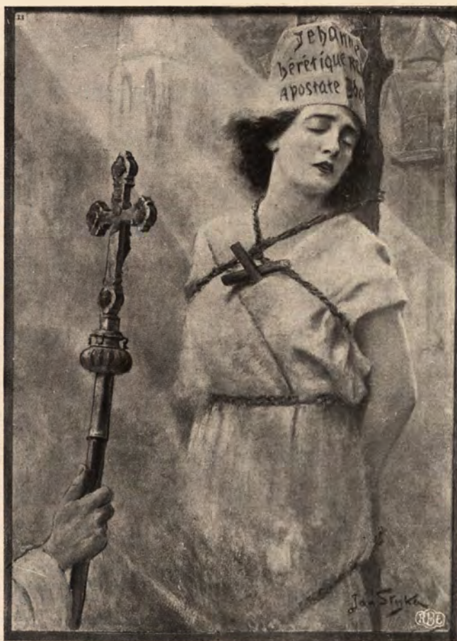
ś. p. JAN STYKA