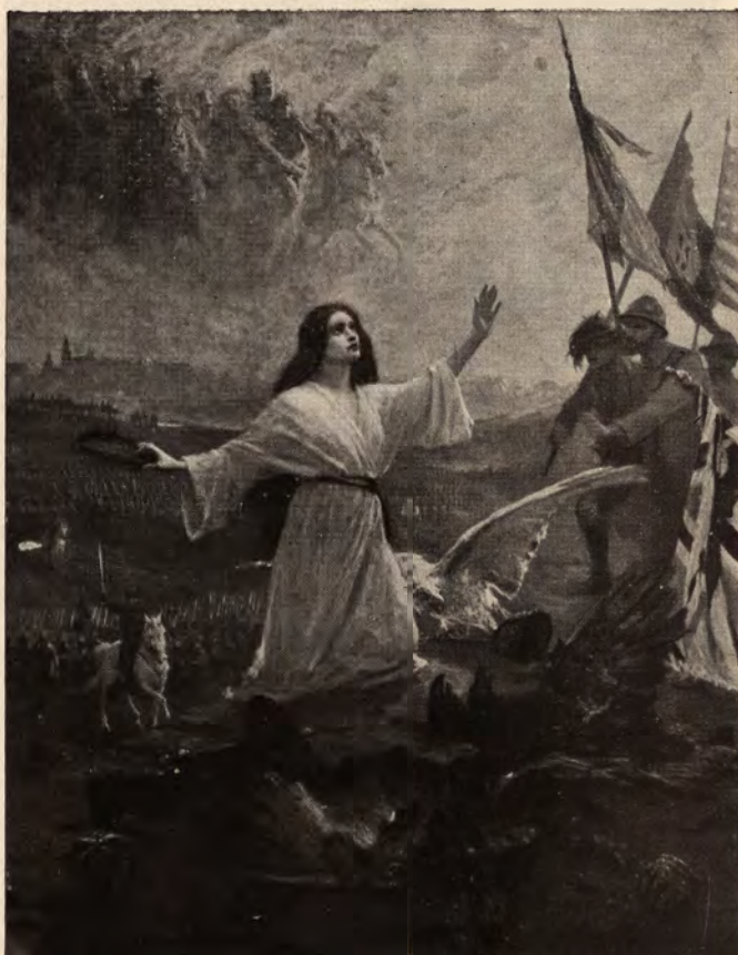
ś. p. JAN STYKA