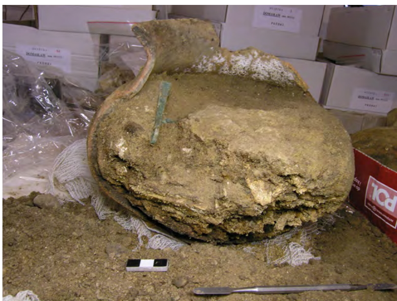
Ryc. 8. Domasław, st. 10/11/12, gm. Kobierzyce. Popielnica z grobu nr 1022