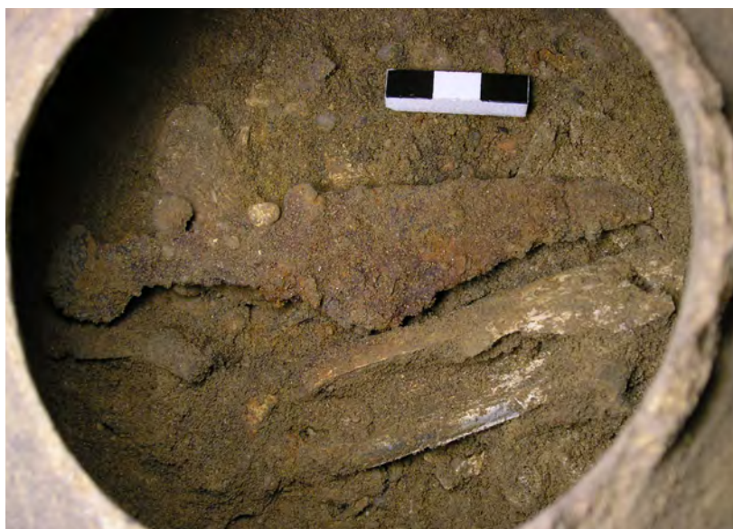
Ryc. 10. Domasław, st. 10/11/12, gm. Kobierzyce. Popielnica z grobu nr 2146