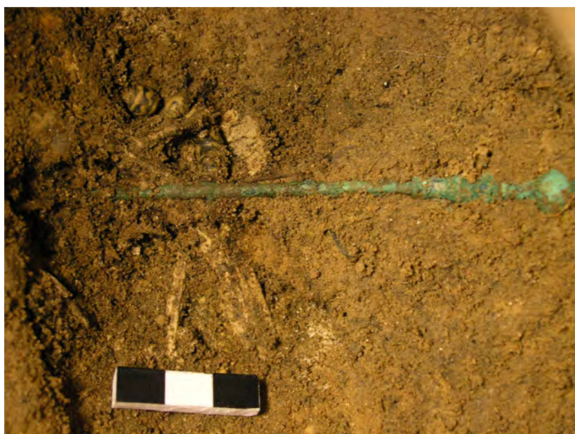
Ryc. 6. Domasław, st. 10/11/12, gm. Kobierzycze. Popielnica z grobu nr 572