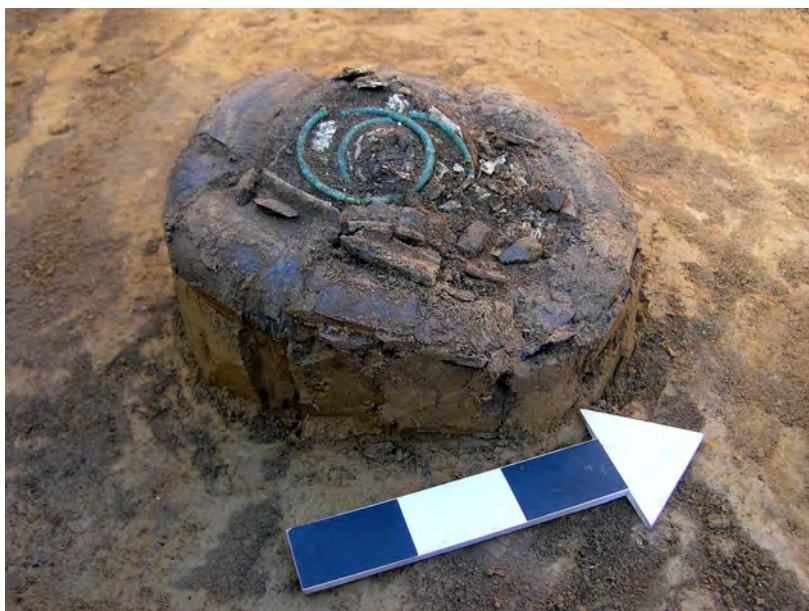
Fig. 3. Domasław, site 10/11/12, Kobierzyce Commune. Urn from the grave No. 5977