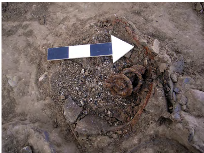
Ryc. 4. Domasław, st. 10/11/12, gm. Kobierzycze. Popielnica z grobu nr 5997