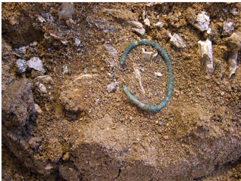
Ryc. 7. Domasław, st. 10/11/12, gm. Kobierzyce. Popielnica z grobu nr 806