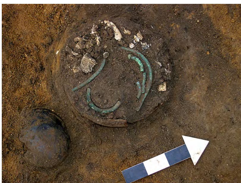
Ryc. 5. Domasław, st. 10/11/12, gm. Kobierzycze. Popielnica z grobu nr 7411