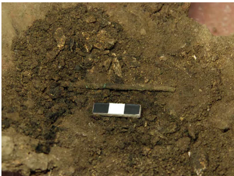
Ryc. 9. Domasław, st. 10/11/12, gm. Kobierzyce. Popielnica z grobu nr 1286