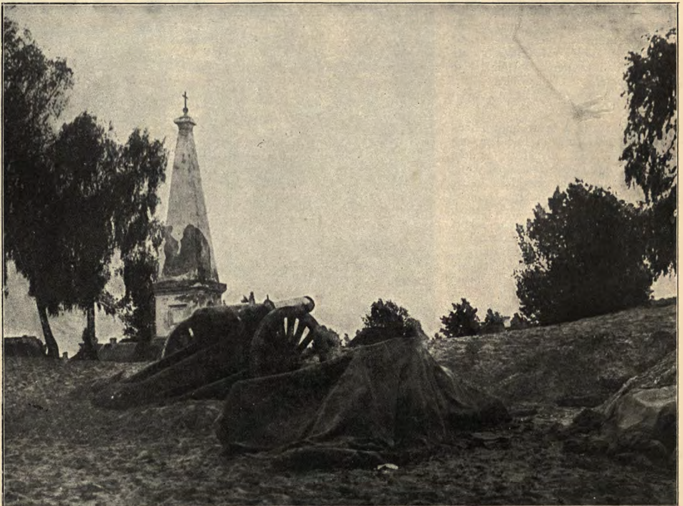
Pozycja artylerji na Wofyniu.

Nie rozśmiać się trudno, ale ostatecznie na rozkaz ogień gaśnie i „sznaprela nie wpuściło“... Został jednak jeszcze jeden przyczynek do charakterystyki owej niesłychanej pogardy śmierci żołnierza legionowego, kwe-