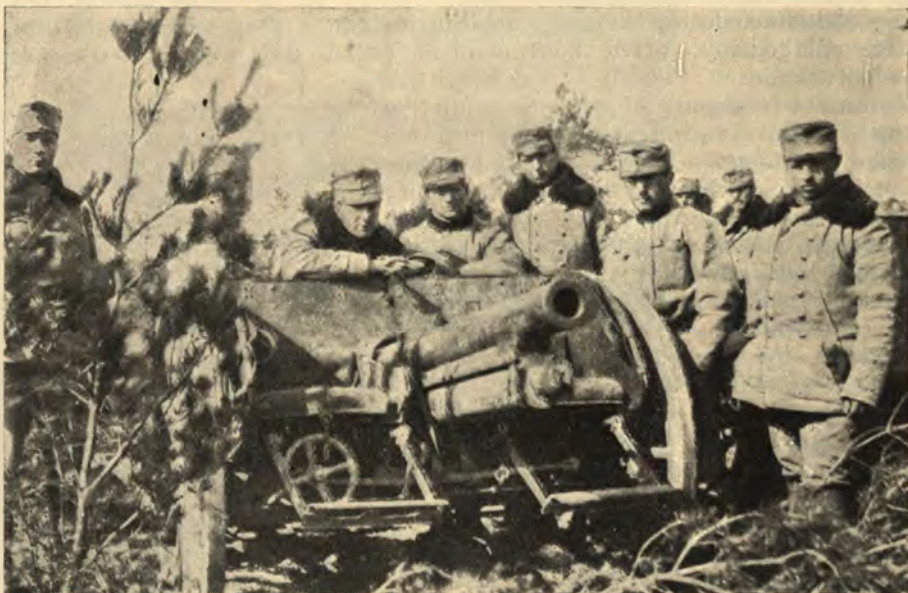
Artyleria 1. Brygady.

ny, swąd dymów. Ani marnego światła, ani najcichszego szmeru, ani najsłabszego poszczekiwania psów. I tak kilka kilometrów przez całą długą wieś. Dierzkowice. Zapalała wprawna ręka. Ani jeden dom się nie ostał. Groza wyzierała z perzyn i gruzów, z lasu kominów, z bezładnej, tragicznej tej alei opalonych drzew.