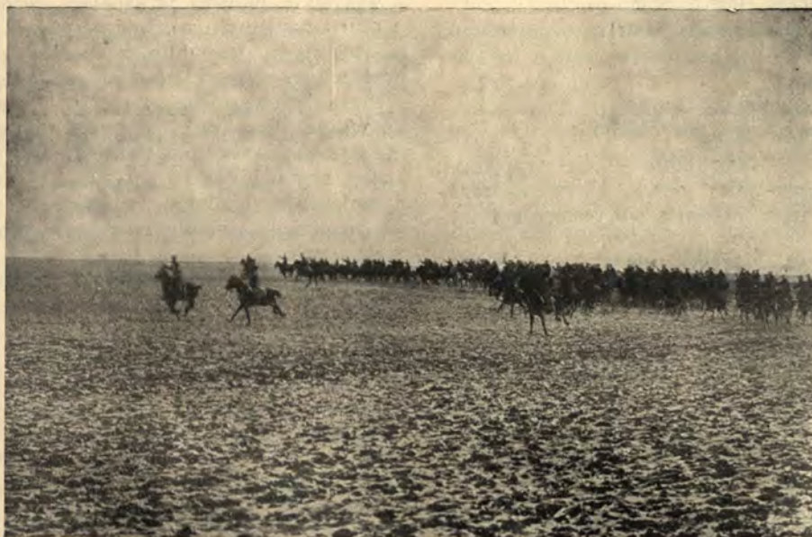
Szarża I. Dywizyonu I. Brygady.