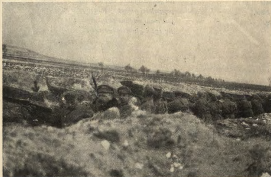
Okopy nad Nidą.

Pragnienia ugasić jednak nie można było. Z godziny na godzinę wzrastało, spalając gorączką wargi, gardła i piersi. Z nastaniem nocy zaginął batalionowy wozi-