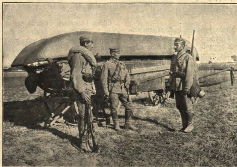
Ponton kompanii saperów.