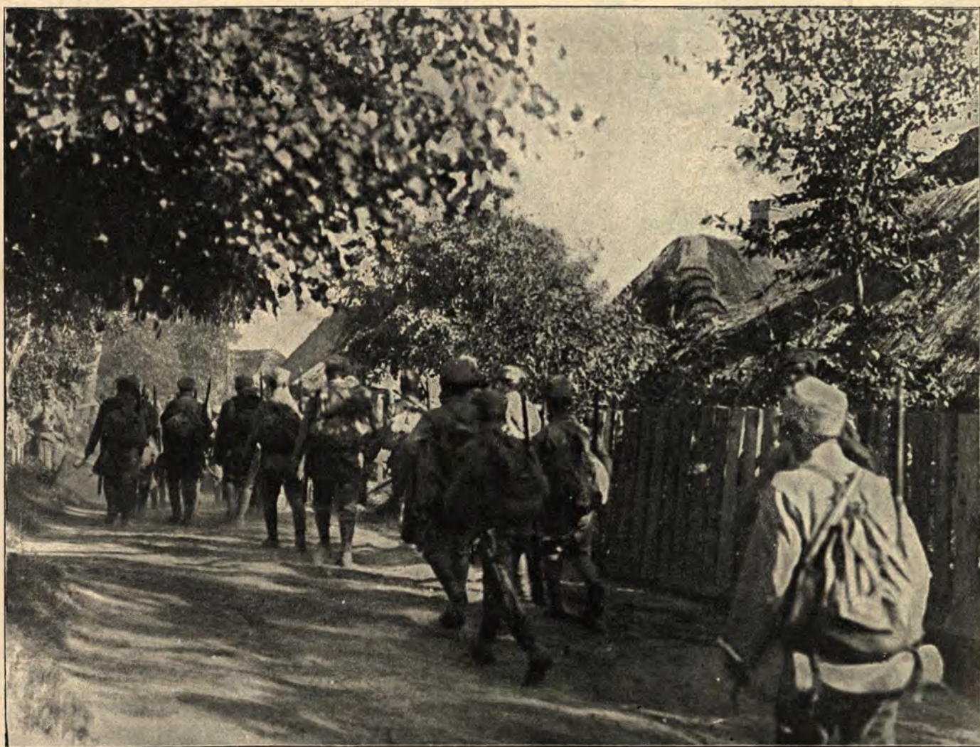
Przemarsz przez Jastków.