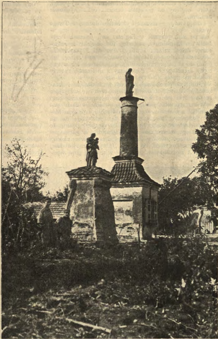
Szlakiem Legionów: Stare figury przydrożne z r. 1613 w Gohubach przy szosie Kowel - Łuck.

Bez nich, bez tych chłopów serdecznych, ongiś ru-