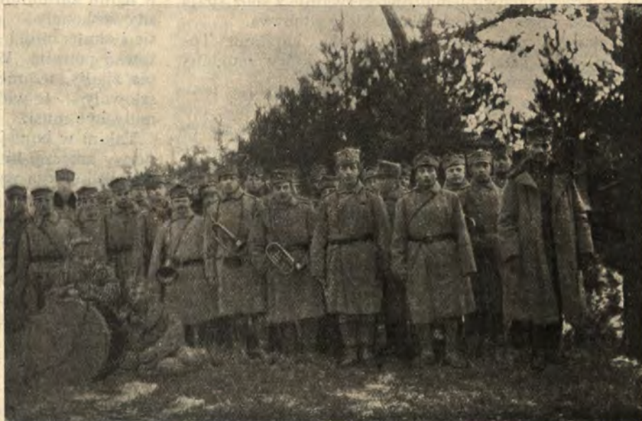
Orkiestra I. Brygady.

Szmat drogi pozostał w tyle, szeregi okopów, po-