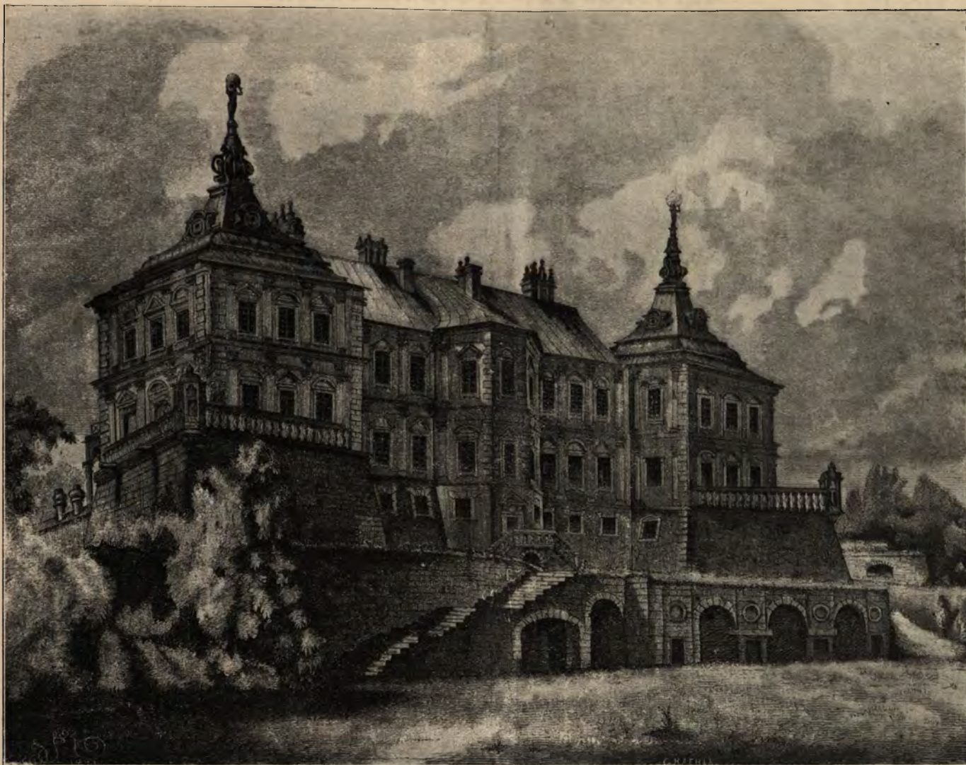
ZAMEK W PODHORCACH.