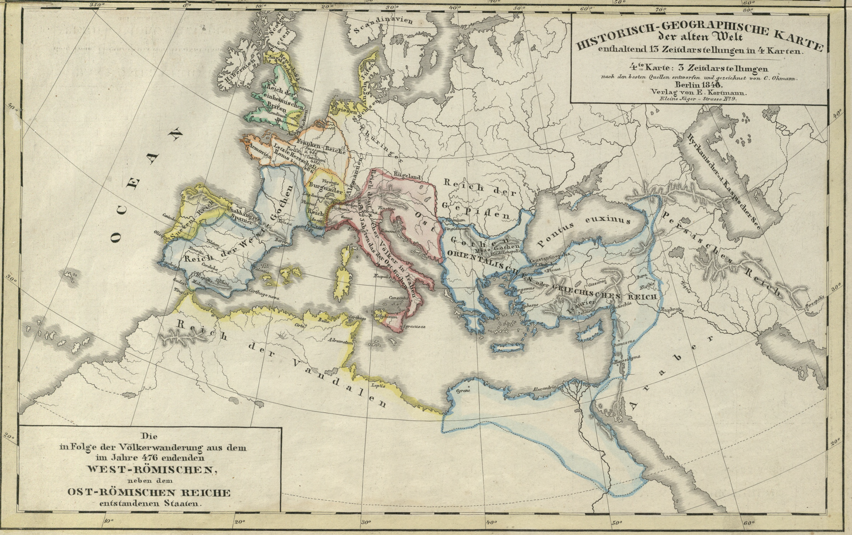
HISTORISCH-GEOGRAPHISCHE KARTE der alten Welt enthaltend 13 Zeitdarstellungen in 4 Karten. 4 te Karte: 3 Zeitdarstellungen nach den besten Quellen entworfen und gezeichnet von C. Ohmann. Berlin 1846. Verlag von E. Kortmann. Kleine Jäger - Strasse N o 9.