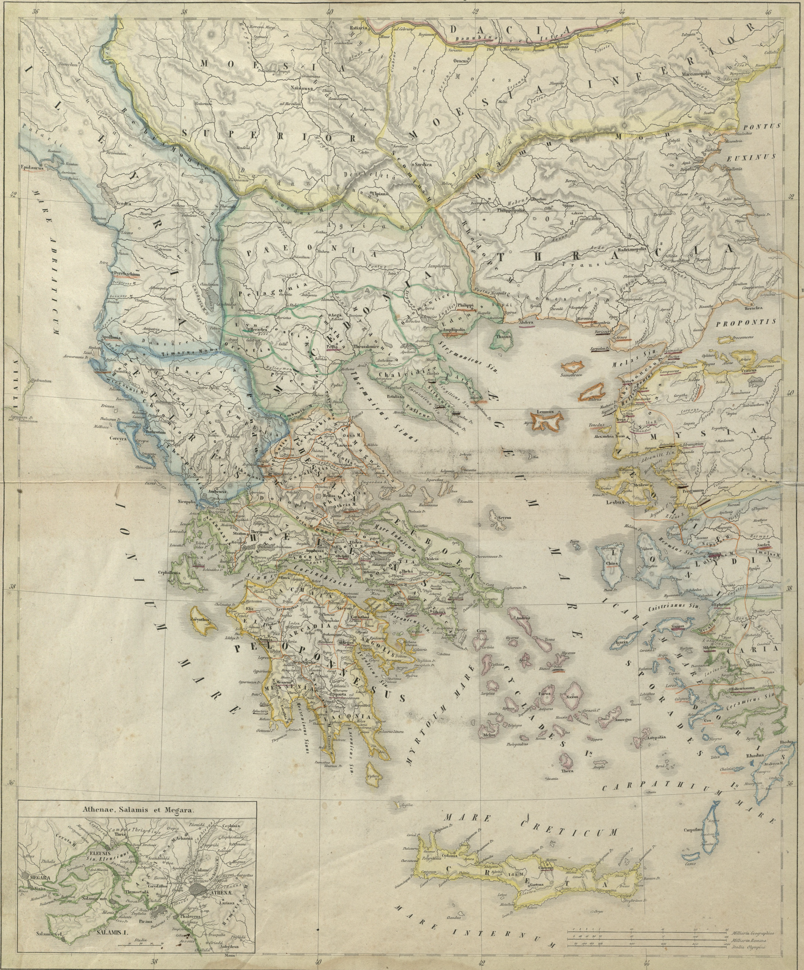
Athenae, Salamis et Megara.