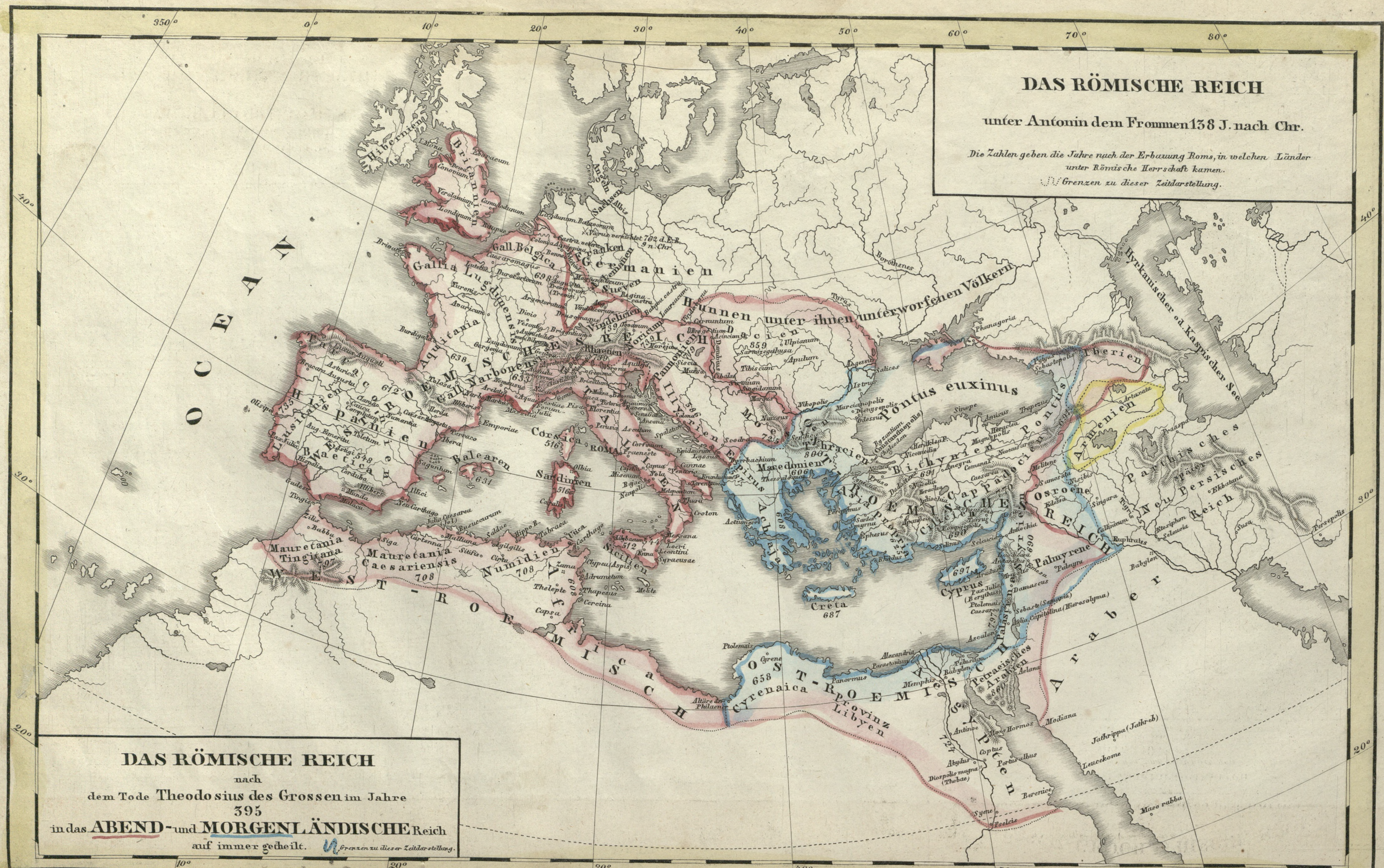
DAS RÖMISCHE REICH unter Antonin dem Frommen 138 J. nach Chr. Die Zahlen geben die Jahre nach der Erbauung Roms, in welchen Länder unter Römische Herrschaft kamen. Grenzen zu dieser Zeitdarstellung.