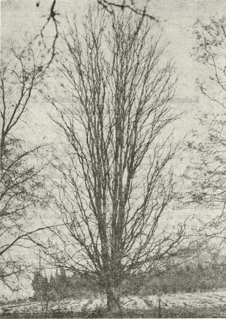
Ryc. 1. Kolumnowa forma glediczji w Arboretum Kórnickim

Kolumnowe formy glediczji są praktycznie nie znane w uprawie i poza wzmianką Schwerina nie są wymienione w żadnym z powszechnie znanych podręczników dendrologii.